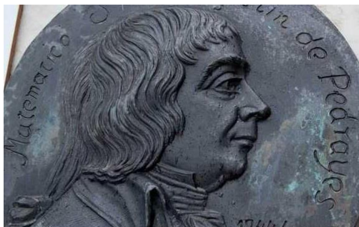
Figura 1. Medallón de Agustín de Pedrayes y Foyo.

Sin embargo, mientras que matemáticos como Vallejo han sido ampliamente analizados desde la educación matemática como, por ejemplo, en el trabajo de Maz-Machado y Rico (2013), no son numerosas las investigaciones sobre Pedrayes. Por este motivo, y desde esta perspectiva, se presenta un breve estudio sobre la vida y obra de Agustín de Pedrayes, así como de sus principales aportaciones a la Educación Matemática.