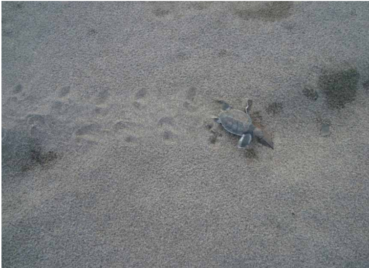
Autoria: Monica Araújo (2013)

Um dado por demais interessante, e isso parece ser endêmico, segundo Georgina Zamora 6 e os pesquisadores Arroyo-Arce; Guilder; Salom-Pérez (2014), diz respeito à cadeia alimentar daquele ecossistema, entre os elos jaguar ( Panthera onca ) e tartaruga verde ( Chelonyx mydas ). Originalmente solitários, mudaram seus hábitos e tornaram-se comunitários, menos competitivos entre si, devido à abundância desses quelônios no seu habitat, inclusive o declínio de suas presas primárias devido à caça ilegal no parque e em seu entorno.