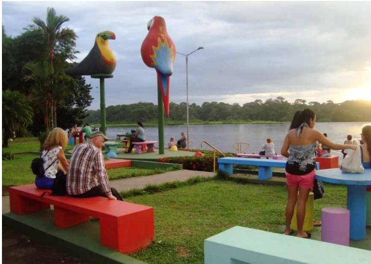
Autoria: Monica Araújo (2013)