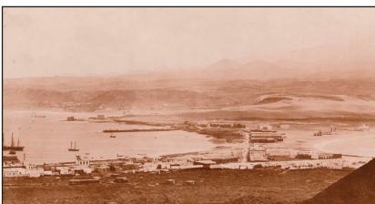
Vista de Las Palmas de Gran Canaria y puerto.