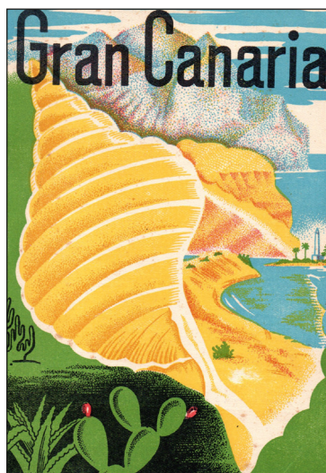
Portada folleto turístico Gran Canaria, década años cincuenta, siglo XX.