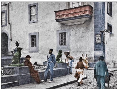
Plaza de Santa Ana y perros.