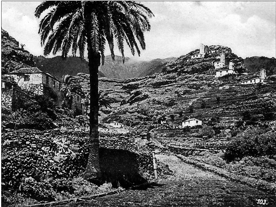
La Quinta Verde.

—muchas de ellas ediciones príncipes—, según sus propias inclinaciones hacia la literatura, las modas de la época y la curiosidad hacia lo prohibido, en un claro afán de coleccionista.