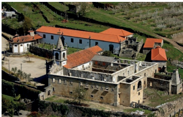
Fig. 8: Capela do Senhor do Bom Despacho, igreja e convento de S.to André de Ancede

A arquitetura da igreja passou por vicissitudes que não estão completamente esclarecidas; a cabeceira é de escala ampla – adequada para ter acolhido um retábulo maneirista – como predizem os caixotões da capela-mor e as naves. A rosácea é o elemento românico remanescente mais significativo, que se difunde, profusamente, no gótico.