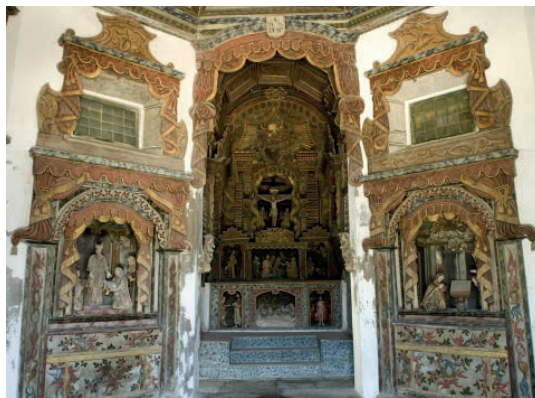
Fig. 10: Capela do Senhor do Bom Despacho

A capela do Senhor do Bom Despacho (Lagoa & Dias, 1991: 467-480), erguida em 1735 - considerada a justaposição da data -, no adro do mosteiro, conserva o retábulo-mor joanino (com acrescentos maneiristas que flanqueiam as pilastras). Programa iconográfico: os mistérios dolorosos e gloriosos da Vida de Cristo; no lado do Evangelho, a Ressurreição, com a legenda: Petit et accipietis