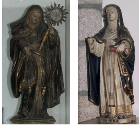
Figs. 6 e 7: Santa Clara e Santa Rosa Lima