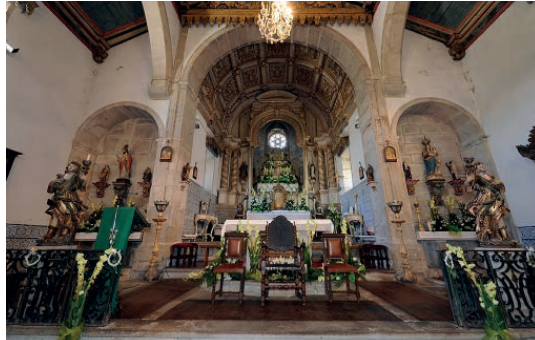
Fig. 9: Capelas mor e laterais da igreja do convento