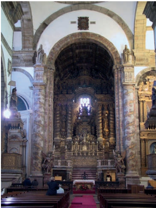
Figs. 4 e 5. Amarante. Retábulo-mor da igreja do convento de S. Gonçalo. Ilhargas da capela-mor da igreja de S. Domingos