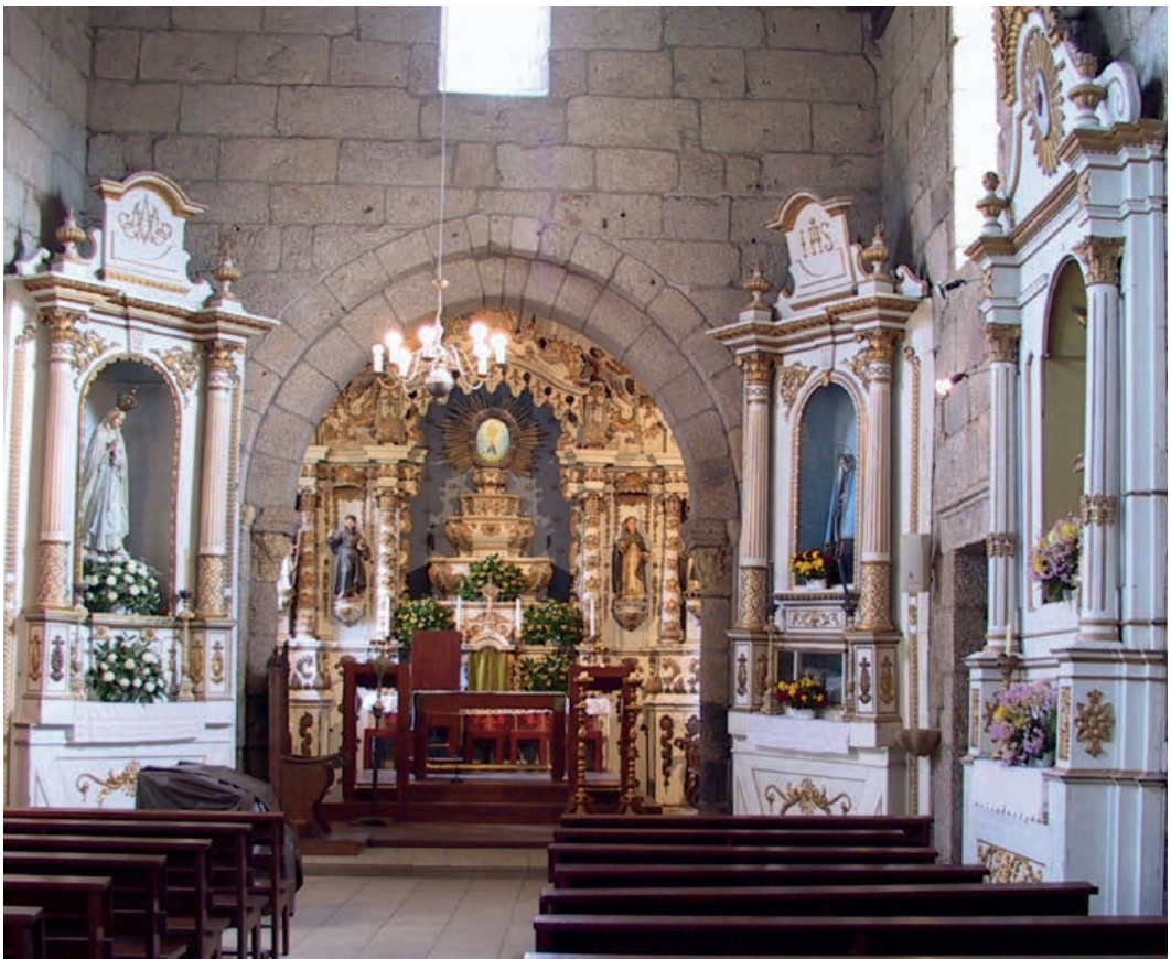
Fig. 2: Amarante. Igreja do mosteiro de Mancelos

Sintetizando: com a integração na RR, apresenta um portal românico (arquivoltas de transição para o gótico) arco cruzeiro igualmente de transição; na talha: i) retábulo-mor “ao estilo” barroco-rococó”; ii) retábulos colaterais e lateral da Epístola: neoclássico residual.