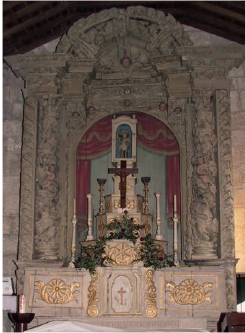
Fig. 3: Amarante. Igreja do Mosteiro de Freixo de Baixo