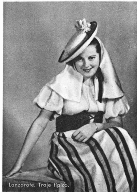
Lanzarote. Traje típico.

En el sector de la Ciudad Jardín, y dentro del Parque de Doramas, está edificándose el Pueblo Canario , paisaje arquitectónico que representa la última palabra, muda, pero elocuente, del gran artista Néstor.