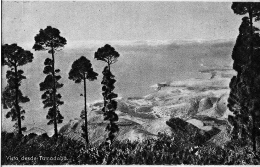
Vista desde Tamadaba.