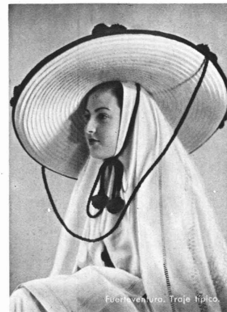
Fuerteventura. Traje típico.

La Caldera de Bandama, cráter apagado, forma un perfecto tazón, que mide 200 metros de profundidad, por 1.000 de diámetro en la parte superior,