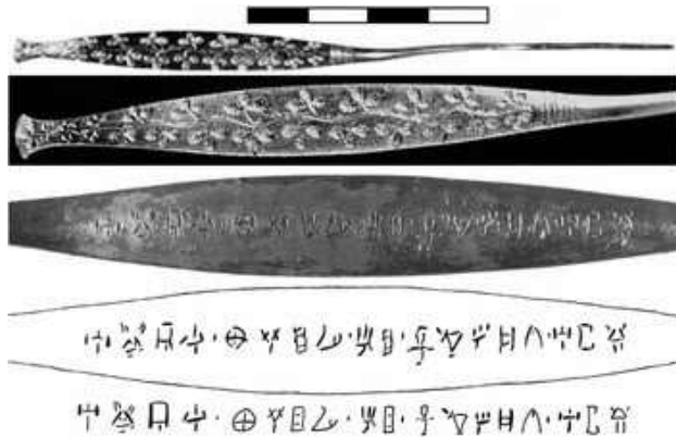
Αργυρή ενεπίγραφη περόνη από τον Πλάτανο (Verduci - Davis, 2015).

ανάστροφης τοποθέτησής τους (Μπουλώτης, 1986: 12). Μακρινά παράλληλά τους είναι τα λεγόμενα «κύπελλα εξορισμών» που απαντούν σε πολιτισμούς της Εγγύς Ανατολής (Naveh - Shaked, 1998, Hunter, 1998) καθώς και οι έως σήμερα αναγραφόμενες, στο εσωτερικό κυπέλλων, σούρες από το κοράνι (Μπουλώτης, 1986: 12).