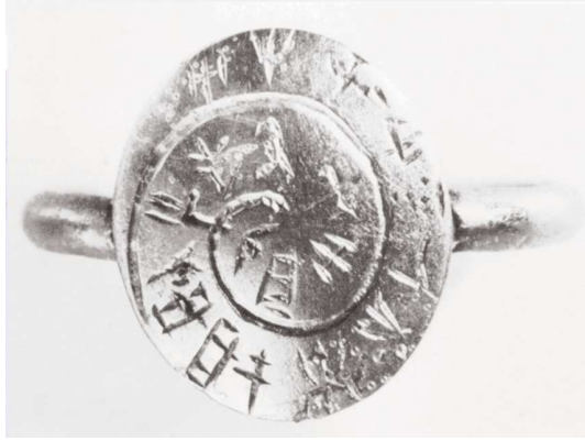
Χρυσό δακτυλίδι από το Μαυρόσπηλιο, GORILA KN Zf 13 , p. 152. https://thingsthattalk.net/nl/t/ttt:TQfYGq/m/directionality-and-readability .

Το πιο χαρακτηριστικό κόσμημα της συγκεκριμένης κατηγορίας είναι το χρυσό δακτυλίδι με μικρό συμπαγή κρῖνιο και ωσειδή συμπαγή σφενδόνη, με επιγραφή Γραμμικής Γραφής Α, από τον θαλαμοσειδή Τάφο ΙΧ στο Μαυρόσπηλιο Κνωσού (Forsdyke, 1926-1927: 264-269, Godart - Olivier, 1982: 152-153, Platon - Pini, 1984: no 38, Verduci - Davis, 2015: 53-54). 2 Προφανώς, αποτελούσε κτέρισμα κάποιας ΜΜ ΙΙΙ-ΥΜ Ι ταφής που είχε πραγματοποιηθεί στον Θάλαμο Ε του συγκεκριμένου ταφικού μνημείου (Μπάνου, 2000: 189). Η σπειροειδής, από την περιφέρεια προς το κέντρο, επιγραφή του συνίσταται σε δεκαεννέα (19) συλλαβογράμματα, δίχως διαχωριστικά κάθετα γραμμίδια ανάμεσα στις λέξεις, γεγονός που οπωσδήποτε δεν οφείλεται στην αβλεψία του χαρακτήρα ή στο μικρό μέγεθος της σφενδόνης (Μπουλώτης, 1986: 13). Θεωρείται, μάλιστα, πιθανό ότι, τα διαχωριστικά σημεία παραλείφθηκαν σκόπιμα είτε για να δοθεί έμφαση στην επιγραφή, προσδίδοντας της ακόμη πιο σύνθετο χαρακτήρα, είτε επειδή η τοποθέτησή τους κρίθηκε περιττή, ειδικά στην περίπτωση μίας και μόνης μαγικής ρήσης με αποτροπαϊκό χαρακτήρα (Μπουλώτης, 1986: 13). Επιπλέον, τη φυλακτήρια λειτουργία και αποτροπαϊκή διάσταση του δακτυλιδιού υποδηλώνει το γεγονός ότι η επιγραφή του είναι αναγνώσιμη πάνω στη σφενδόνη αλλά όχι και στο αποτύπωμά της, πράγμα που σημαίνει ότι το κόσμημα δεν ήταν, πρωταρχικά τουλάχιστον, σφραγιστικό (Μπουλώτης, 1986: 13).