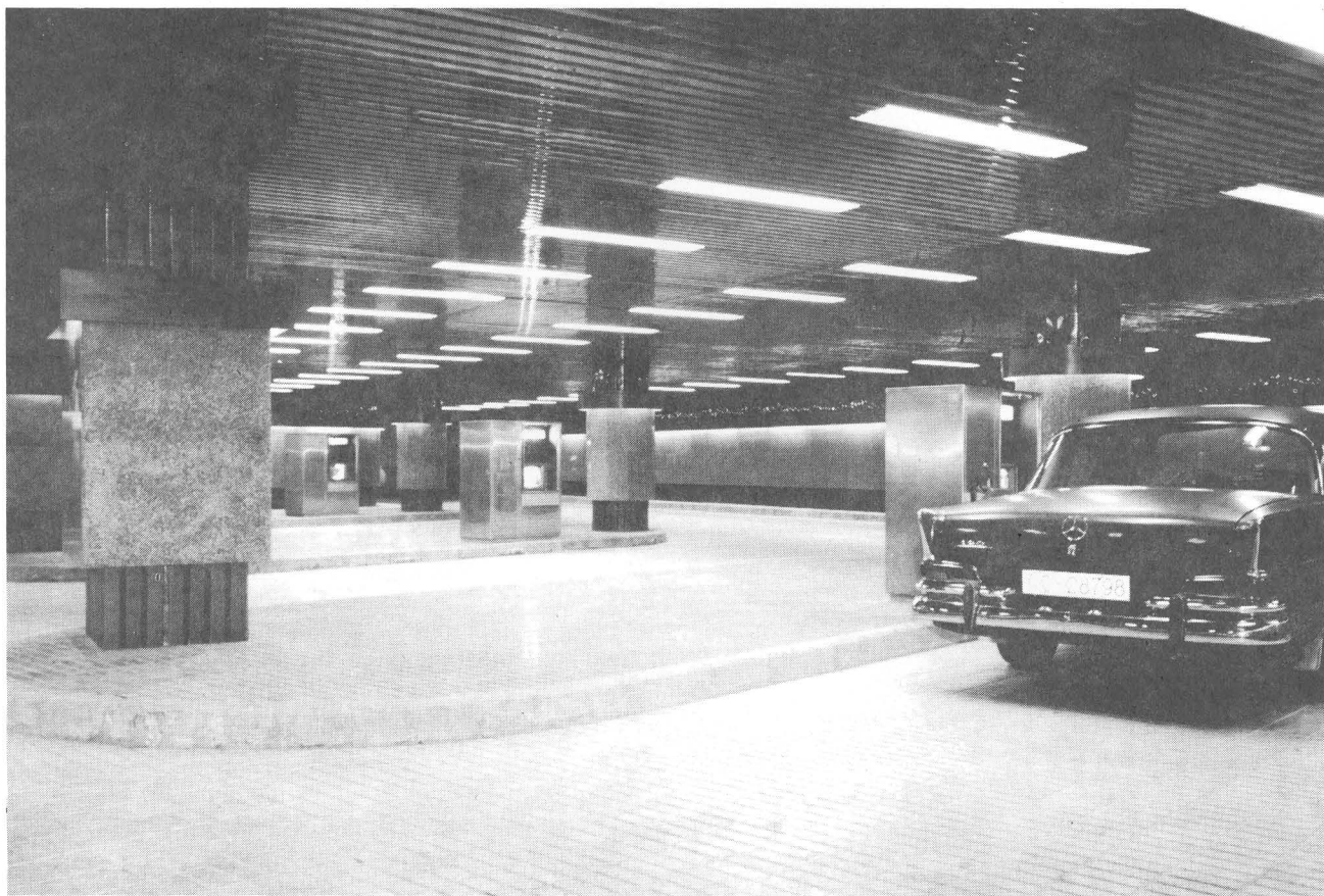
Vista del Auto caja con sus tres terminales.

Una de las características básicas de la humanidad es la necesidad de desplazarse. A lo largo de la historia se puede apreciar que se trata de algo inherente a la persona. El hombre ha conseguido grandes adelantos en este sentido, pero también se enfrenta a notables dificultades. En ciudades como Las Palmas de Gran Canaria que tienen una superficie limitada en la que se concentran gran cantidad de personas y actividades, surgen graves problemas para el tráfico rodado. Pero no trataremos en estas líneas de sus soluciones; tratamos de comentar la próxima puesta en servicio de un moderno sistema, muy difundido por Europa y Norteamérica, denominado Auto caja, y puede tener una gran repercusión entre los automovilistas.