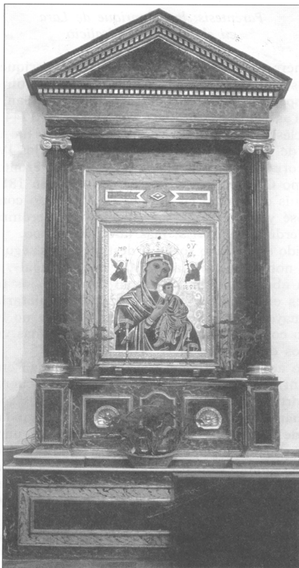
FIGURA 5.—Retablo de jaspe en la nave de la Epístola. Estuvo en la capilla de La Antigua de la catedral, que lo donó a la ermita. Reformado en 1964 por José Arcibia.