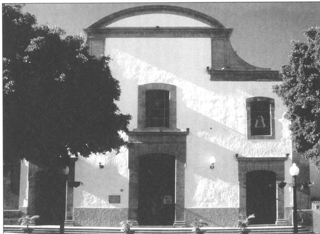
FIGURA 2.—Fachada de la hoy parroquia de San Gregorio Taumaturgo.