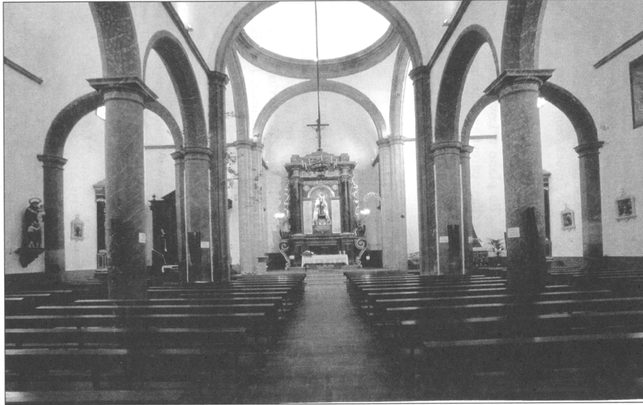
FIGURA 3.—Vista del interior del templo. Enorme para una ermita.