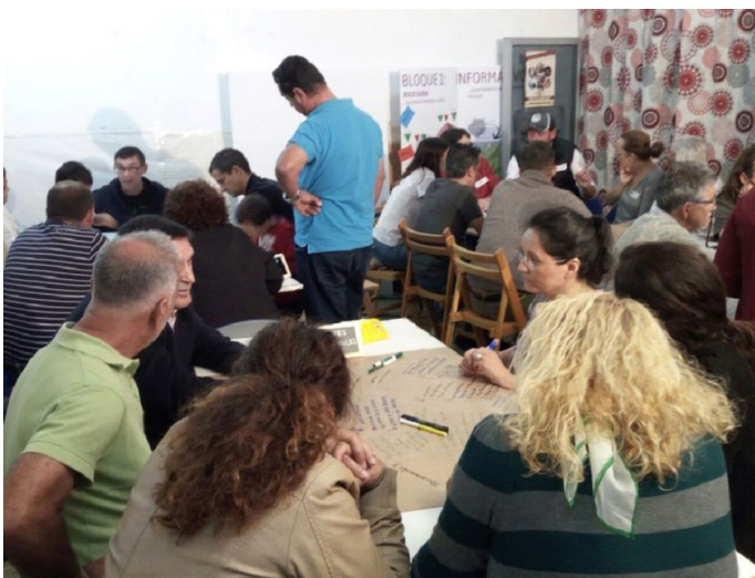
Encuentro ciudadano celebrado en Barranco Hondo de Abajo