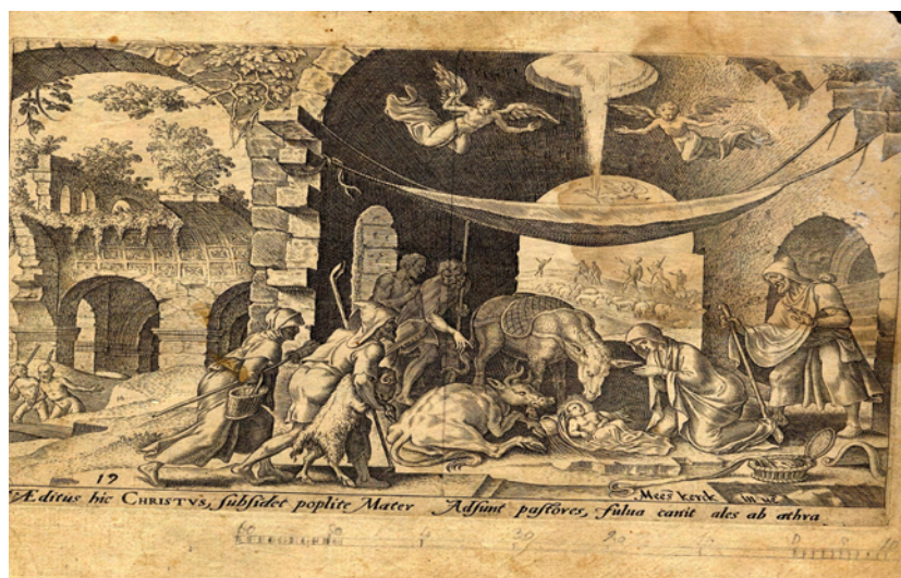
Figura III. Adoración de los pastores.