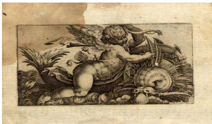
Figura IV. Cupido y los monstruos marinos.

Se comprueba un gramaje de cierta densidad en el papel empleado por Galle, distinguiéndose con claridad el entramado con los corondeles y puntizones. La filigrana (marca de agua) apenas se reconoce, observándose una especie de “cañón”, elemento adoptado como “copyright” por algunas empresas productoras de papel de entonces.