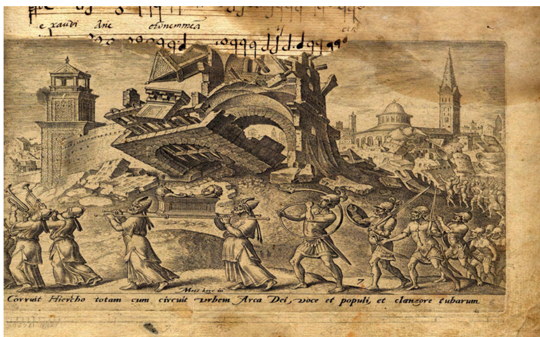
Figura II. Destrucción de las Murallas de Jericó.