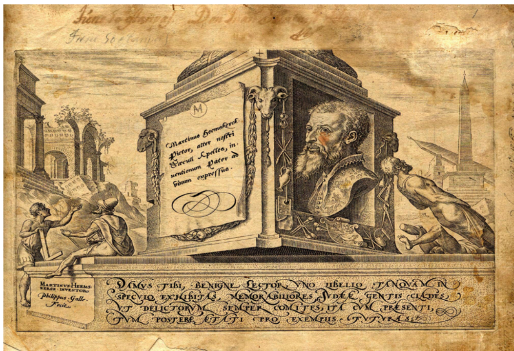
Figura I. Portada con la representación de Maarten van Heemskerck.