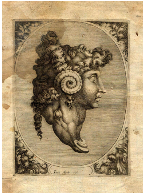
Figura V. Fauno.