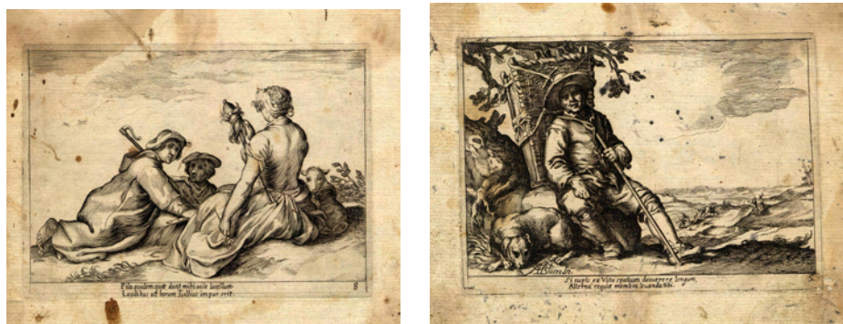
Figura VII. Escenas campesinas.

Este mismo cuaderno contiene, asimismo, otra sugestiva serie de grabados calcográficos salida del buril de Abraham Bloemaert (1564-1651), quien sobresalió como pintor en la ciudad de Utrecht. Formado en el taller de su padre, el escultor Cornelio Bloemaert, marcha a estudiar a París. Contó con maestros de la talla de Gerrit Splinter y Joost de Beer. Fue un gran admirador de Caravaggio, cuya influencia se deja sentir en los temas pastoriles, buena parte de ellos en el Kijksmuseum (Holanda). Aunque trabaja como grabador en el estudio de Cornelio de Haarlem, su estilo está más próximo al de Goltzius.