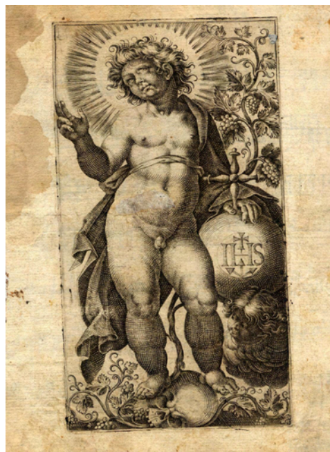
Figura VI. Redentor Mundi.

Aunque no constituyendo un elemento correlativo de esta serie, se encuentra otra espléndida estampa que representa al Niño Jesús como “Redentor Mundi”, de pie, desnudo sobre una calavera, en actitud de bendecir y apoyándose en el globo terráqueo que contiene el anagrama “I-H-S”. Una ensortijada viña llena de racimos hace alusión a la Eucaristía. No aparece firmada, pero por las características del dibujo, del proceder del buril, de la trama y del propio lenguaje, creemos que se halla dentro del estilo de Maglioli, que vuelve a poner el acento entre la intensidad del color negro y las tonalidades de blancos. Pertenece a la misma plancha que los grabados anteriores a tenor de sus dimensiones, 160 x 80 mm. el entintado, y 180 x 140 mm. con los márgenes.