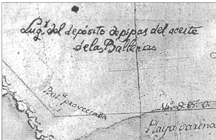
MAPA 4 TRIS.—Detalle del Plano de la Isla de Gorriti.