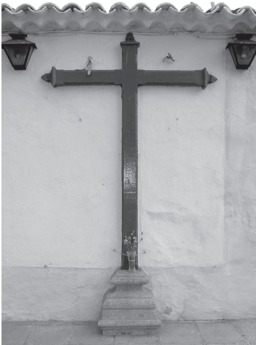
Cruz del camino de san Lázaro.