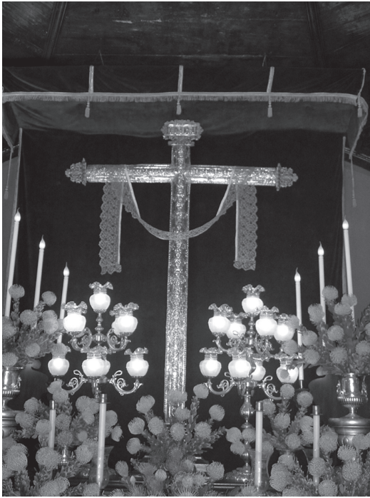
Capilla de cruz de san Juan.