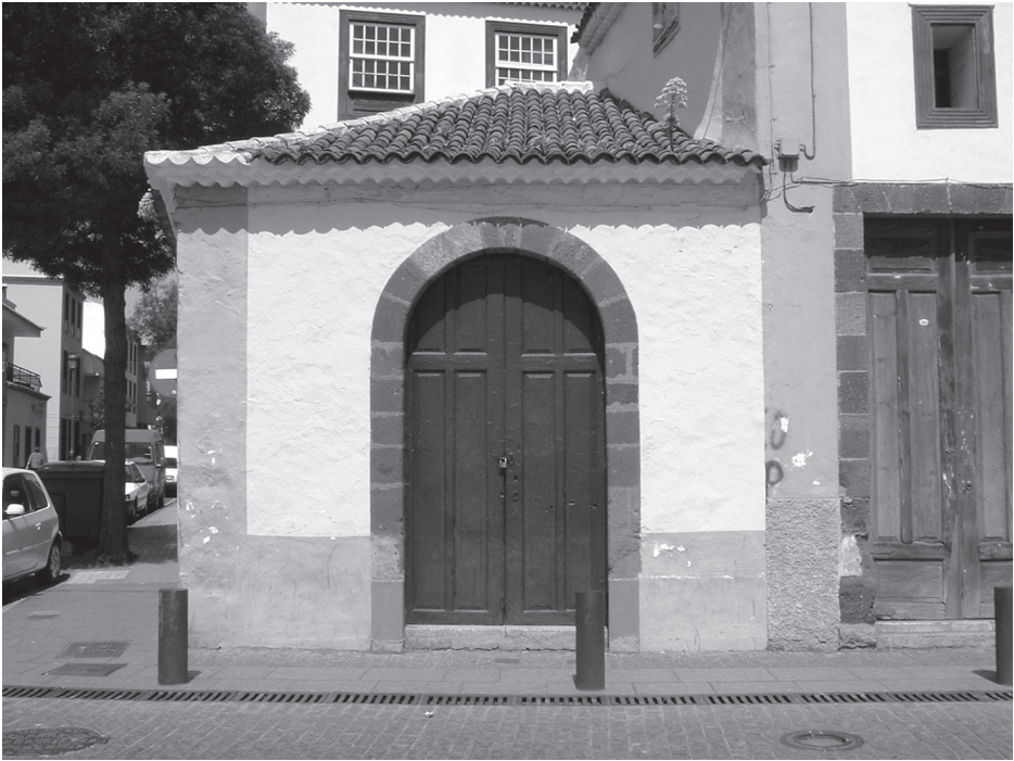
Exterior de la capilla de cruz de san Francisco.