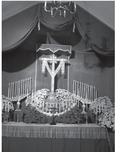
Interior de la capilla de san Francisco.