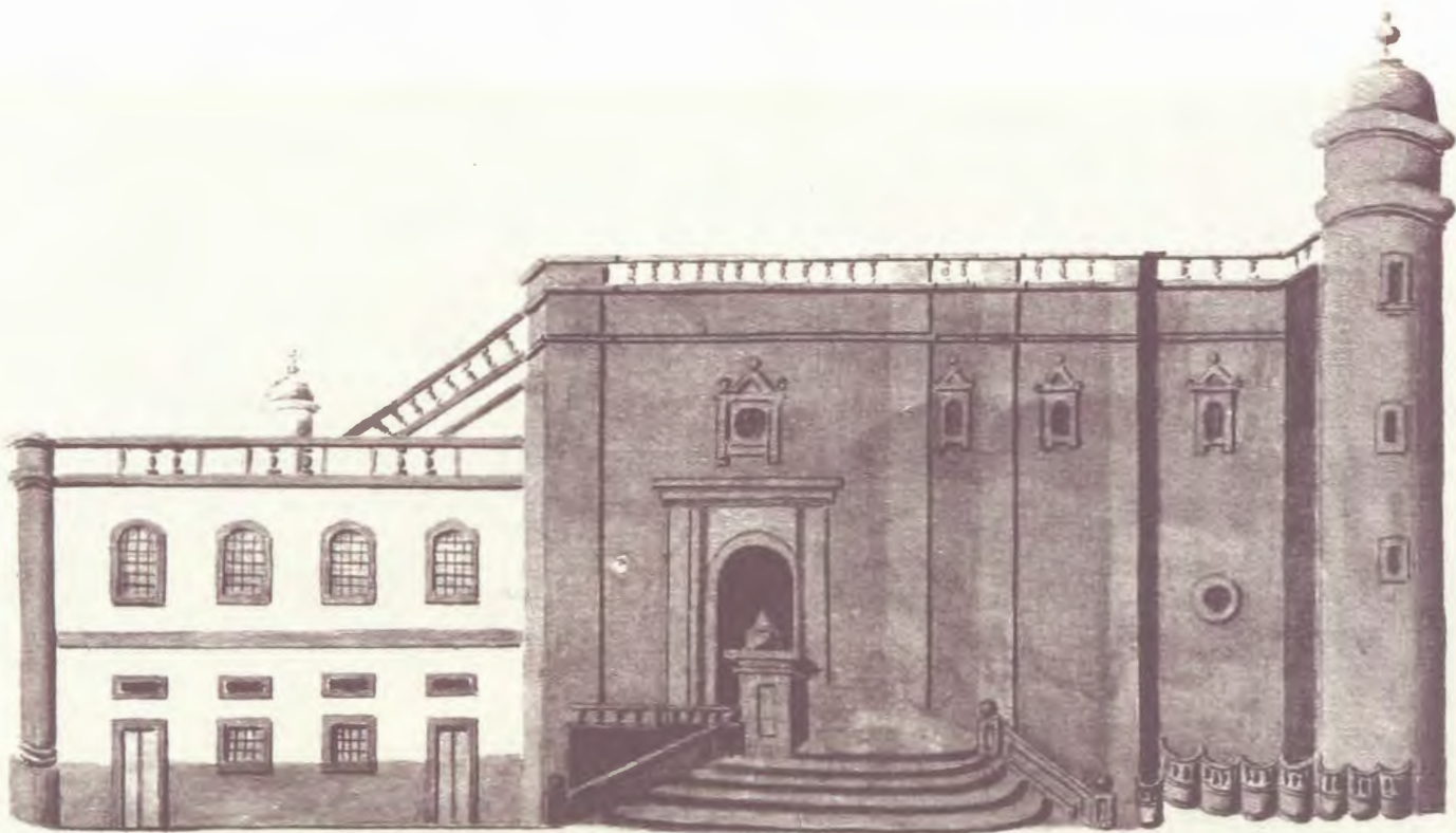
JOSÉ AGUSTÍN ÁLVAREZ RIXO: Costado del S. E. de la Catedral. 1807