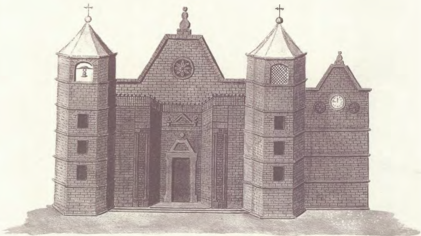
JOSÉ AGUSTÍN ÁLVAREZ RIXO: Fachada de la Catedral de Canaria