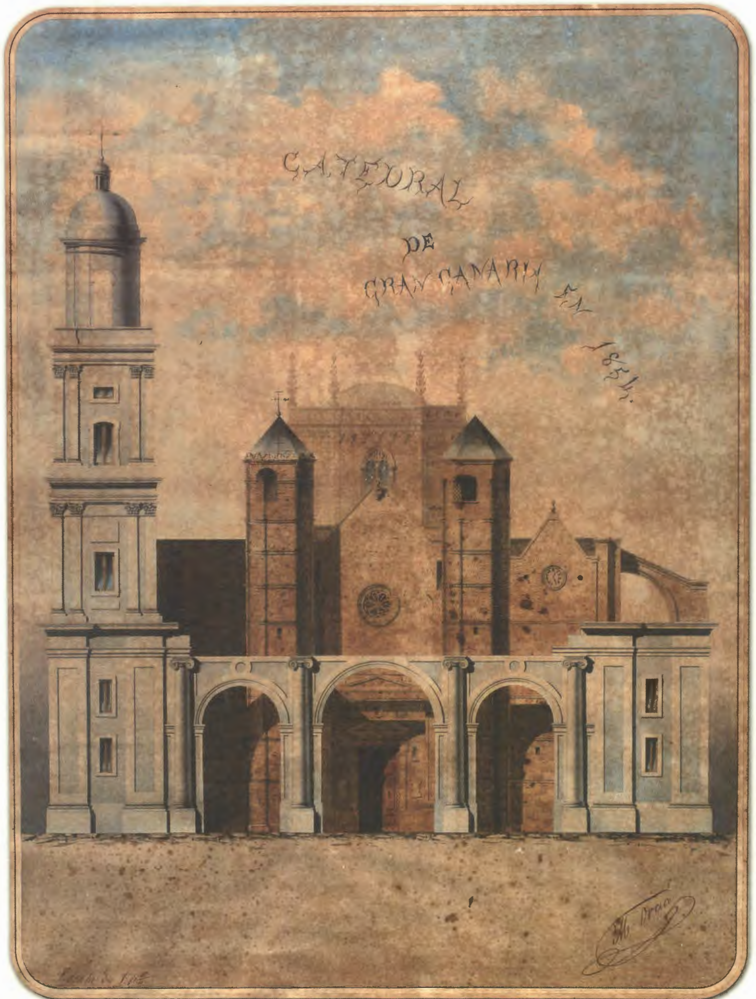
MANUEL DE ORAA: Catedral de Gran Canaria en 1854 . Colección particular. Tenerife