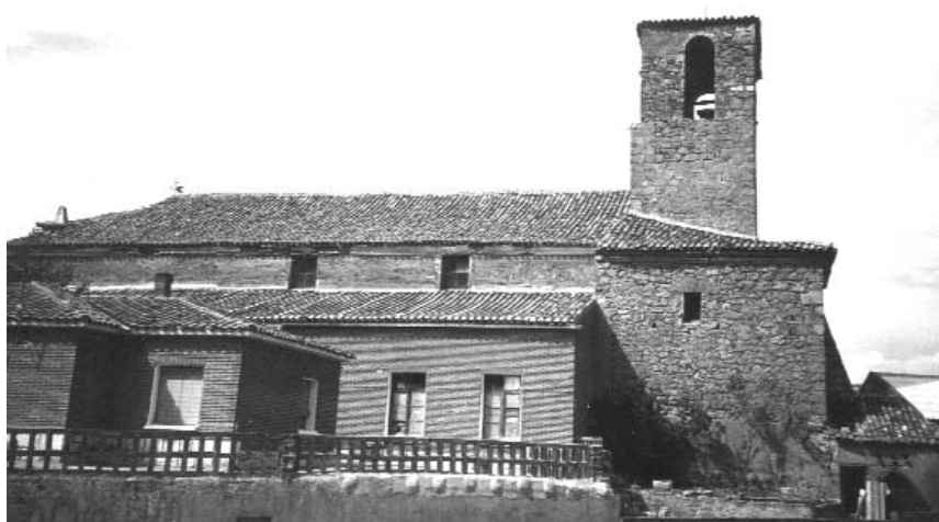
Foto 2. Cabrerros del Monte (Valladolid). Iglesia de San Juan Bautista.