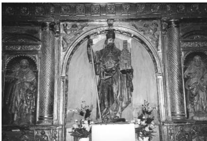
Foto 3. Cabrerros del Monte (Valladolid). Retablo de San Agustín.