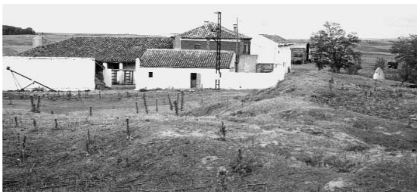
Foto 10. Mayorga de Campos (Valladolid). Villalogán: Mota del Castillo y finca.

O en la exención de la jurisdicción del merino real por parte del rey Alfonso X en el año 1257 71 :