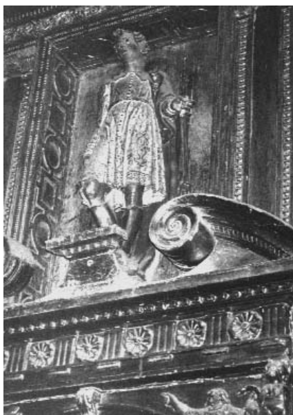
Foto 4. Cabrereros del Monte (Valladolid). Retablo de San Pelayo.

do el topónimo a una distancia absurda: «... que ha sido identificada con el castillo de Olocau, llamado en árabe Hisn al-Uqab (castillo del águila), sito a 20 kilómetros de Morella». Inmediatamente realicé la pertinente aclaración en el lugar que cito abajo 11 .