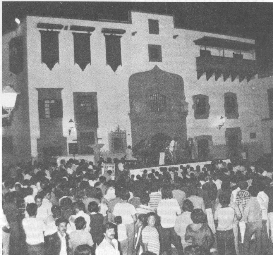
Aspecto de la Plaza del Pilar Nuevo durante el concierto del sexteto "Spirit of 76"

Nuestra Entidad ha conmemorado el LVII Día Universal del Ahorro con la celebración de numerosos actos culturales y espectáculos que se han desarrollado en las islas de Gran Canaria, Lanzarote y Fuerteventura durante el mes de octubre.