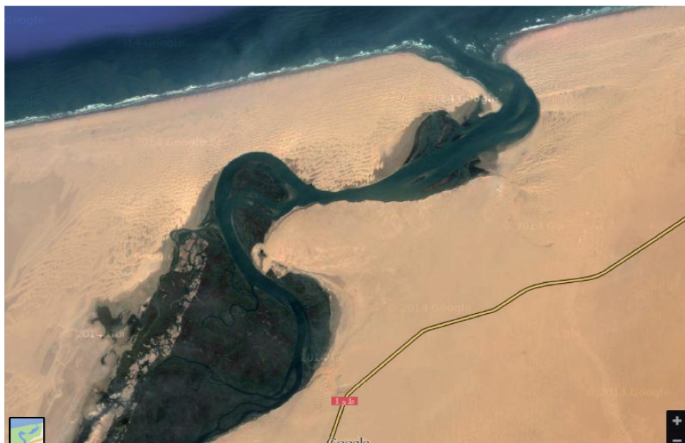
Foto 4: Vista vía satélite del Parque Nacional de Khnifiss, antiguo «Puerto Cansado», donde se encuentran los restos de la torre.