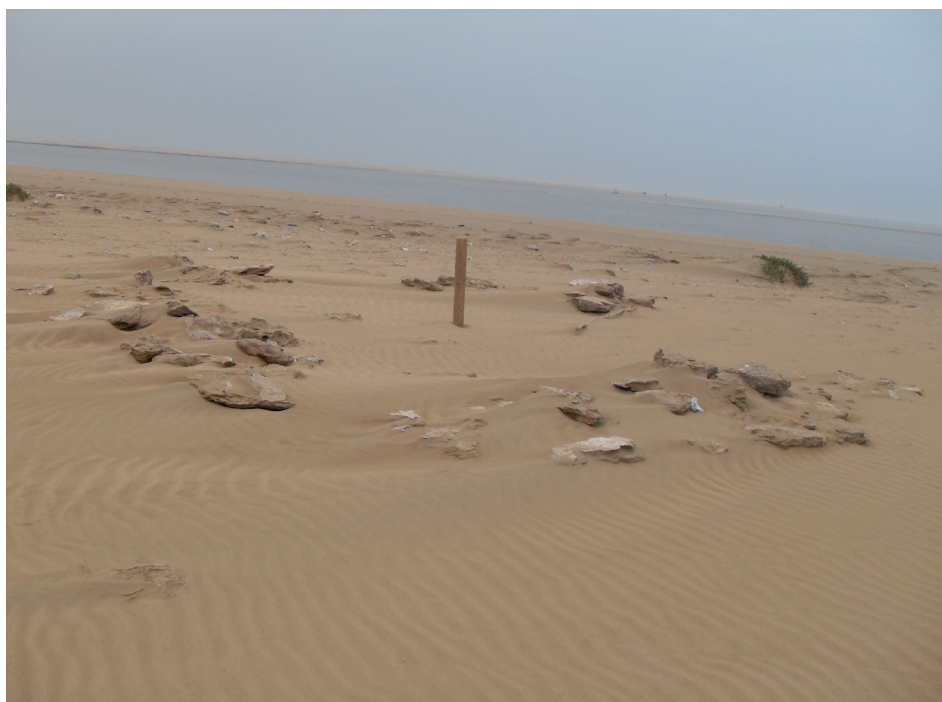
Foto 1: Lugar donde se encontraba la torre antes de los trabajos de excavación.

L'objet du présent chantier est le désensablement du monument historique nommé «Bourj Aguitir» correspondant à la tour factorerie de «Santa Cruz del Mar Pequeña» dans la baie de «Puerto Cansado», fondé entre 1454 et 1478. Nous avons travaillé au sein la lagune Khnifiss pour promouvoir l'écotourisme et dans ce sens nous voulons appuyer les circuits maritimes à l'intérieur de la lagune par un circuit culturel qu'on a nommé circuit «Santa Cruz de Mar Pequeña» et faire une interprétation historique sur le site. Nous avons décidé avec les locaux de la région de réaliser un chantier de désensablement avant que les traces de vestige disparaissent et ceci sera devenu difficile à désensabler. On a réalisé un atelier comme vous vu sur la photo avec les locaux en montrant l'importance historique de site et en suite j'ai trouvé leur appui ainsi l'appui de l'agence de sud et j'ai commencé les travaux. Maintenant je cherche à construire le volume de la tour en bois sur ce qui reste de la tour qui aura un double rôle, un point d'observation et donne l'idée de la forme originale de la tour 75 .