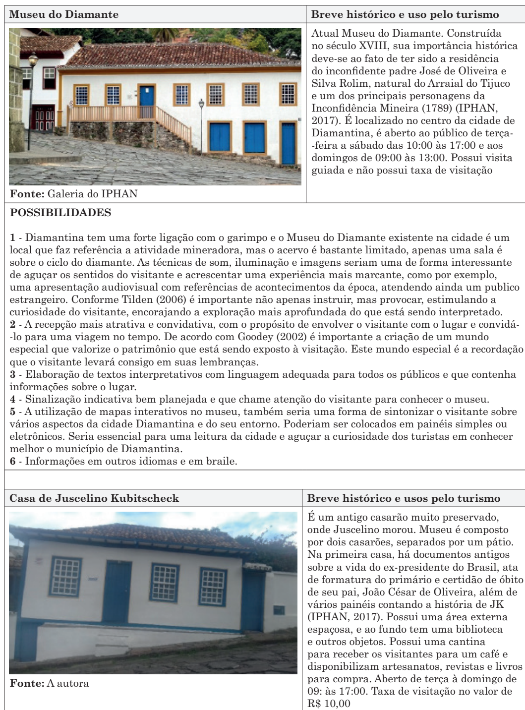
Tabela 8: Possibilidades interpretação patrimonial