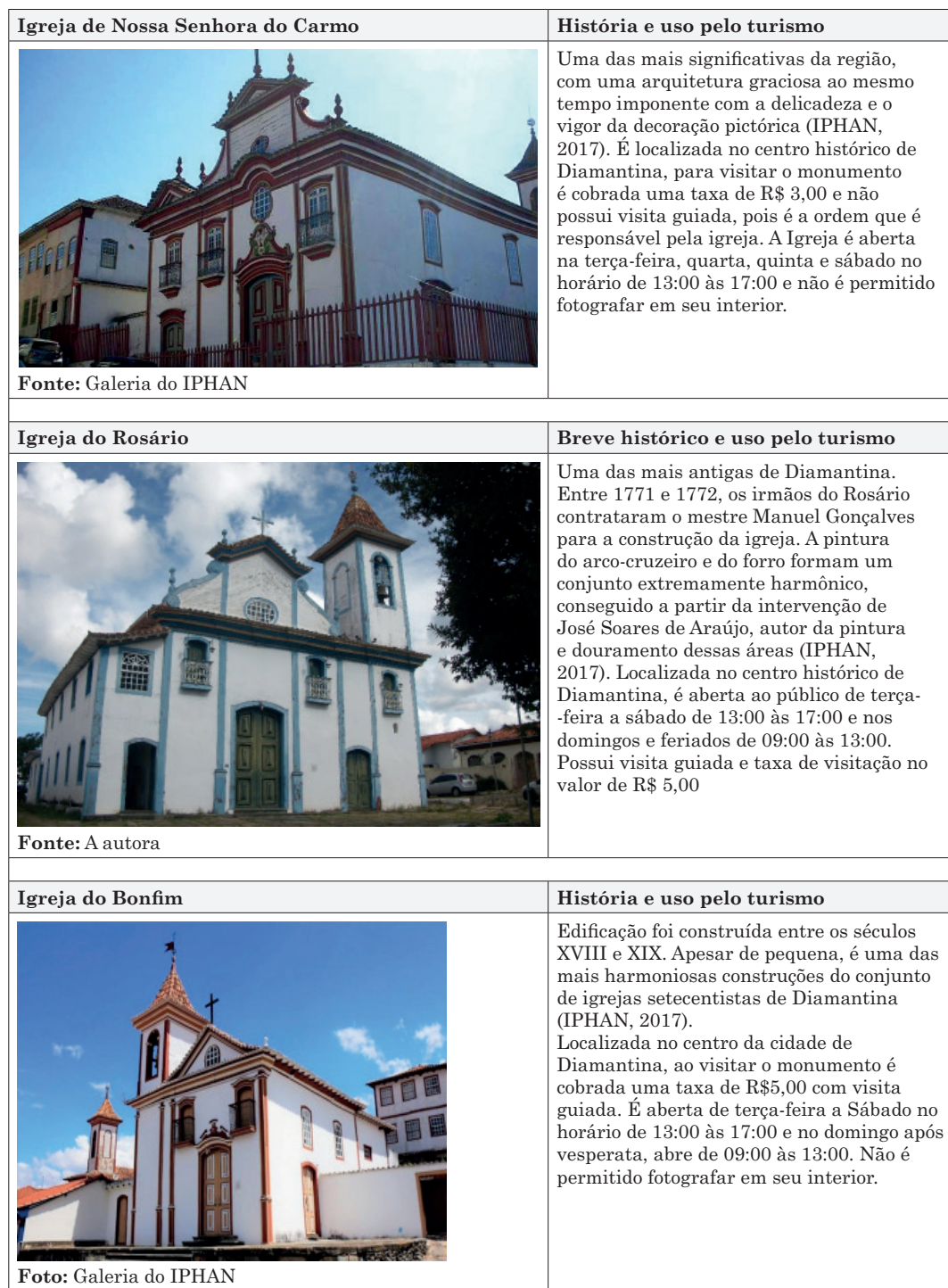
Tabela 9: Possibilidades interpretação patrimonial nos monumentos religiosos