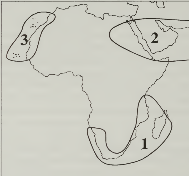
Fig. 2. Actuales relictos de la Rand Flora (RIVAS GODAY & ESTEVE CHUECA [36]. 1: Región de El Cabo; 2: Región Sudano-Síndica; 3: Noroeste de África y archipiélagos atlánticos.