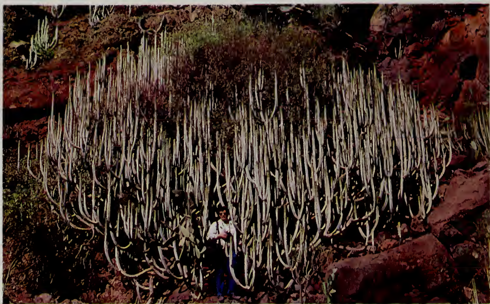
Fig. 3. Portentoso ejemplar de cardón en el cauce del Barranco del Rey (Adeje), con un almácigo ( Pistacia atlantica ) en su interior.