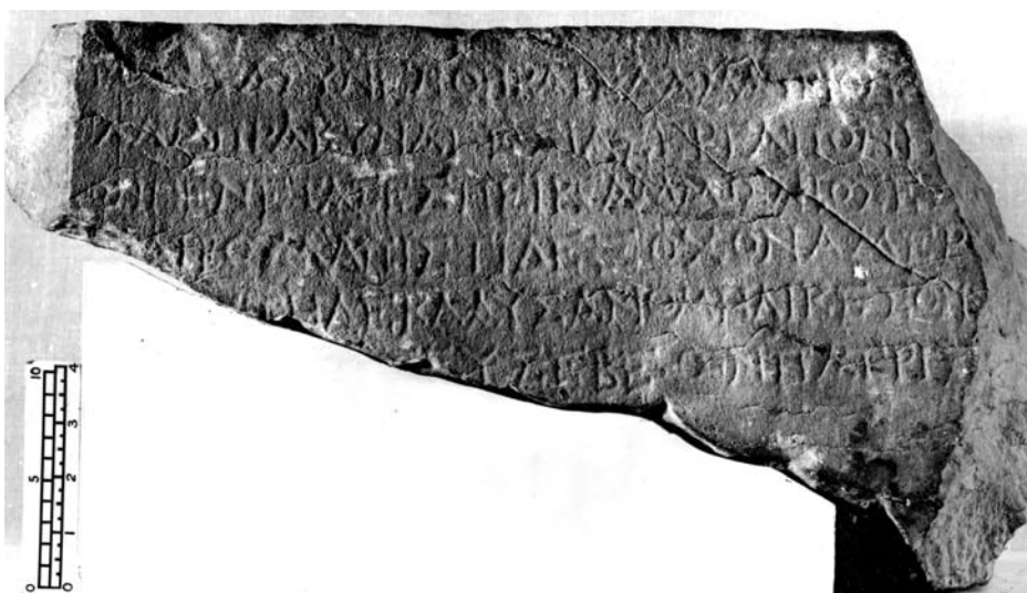
Figura 3. Fotografía del Fitzwilliam Museum (Negative No.: FMS.25).