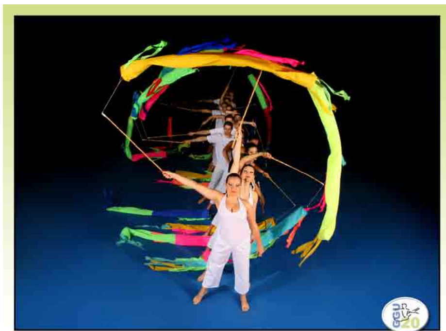
Imagen 1. Grupo Gimnástico UNICAMP (GGU) - Composición coreográfica: Piaba

“La gimnasia artística es una modalidad deportiva que requiere mucho tiempo de preparación. Ello obliga al profesor a elegir una metodología que acorte al máximo ese <<tiempo de preparación>>, no sólo desde el punto de vista de la técnica de los movimientos, sino también desde el de las condiciones físicas indispensables” (KNIRSCH, 1974: 358).