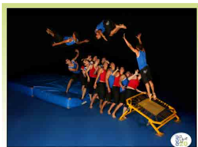
Imagen 3. Grupo Gimnástico UNICAMP (GGU) - Composición coreográfica: Mini-trampolín

Nos parece que no es necesario seguir de modo estricto la “secuencia de complejidad” de las prácticas gimnásticas que hemos analizado, no obstante, al tenerla en cuenta podremos planificar con mayor fundamentación y rigor nuestras decisiones pedagógicas. Por otra parte, al conocer la existencia de una gran variedad de lógicas internas entre las diferentes modalidades gimnásticas, significa que también tendremos que ofrecer esta variedad a nuestros alumnos.