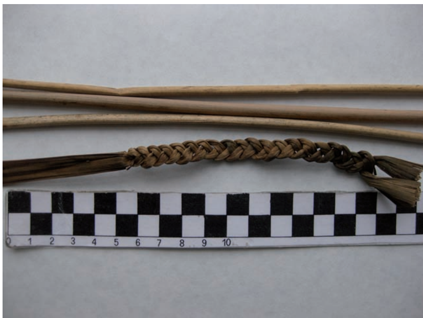
Fig. 4. Comparativa entre junco seco y otro tintado con pisolithus.

Igual que sus predecesores se realizaron ensayos tanto en frío como en caliente. El procedimiento consistió en triturar y convertir en polvo las muestras. Posteriormente se introdujeron en agua y por separado se emplearon la sal marina y la orina, a modo de mordiente, sobre fibra vegetal (junco y palma) y fibra animal. Fig. 4.