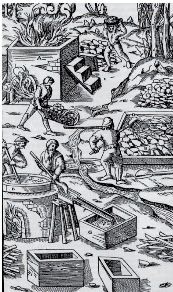
Fig. 7. Tratamiento de alunita para la obtención de alumbre. F: PICON (2005), p. 22.