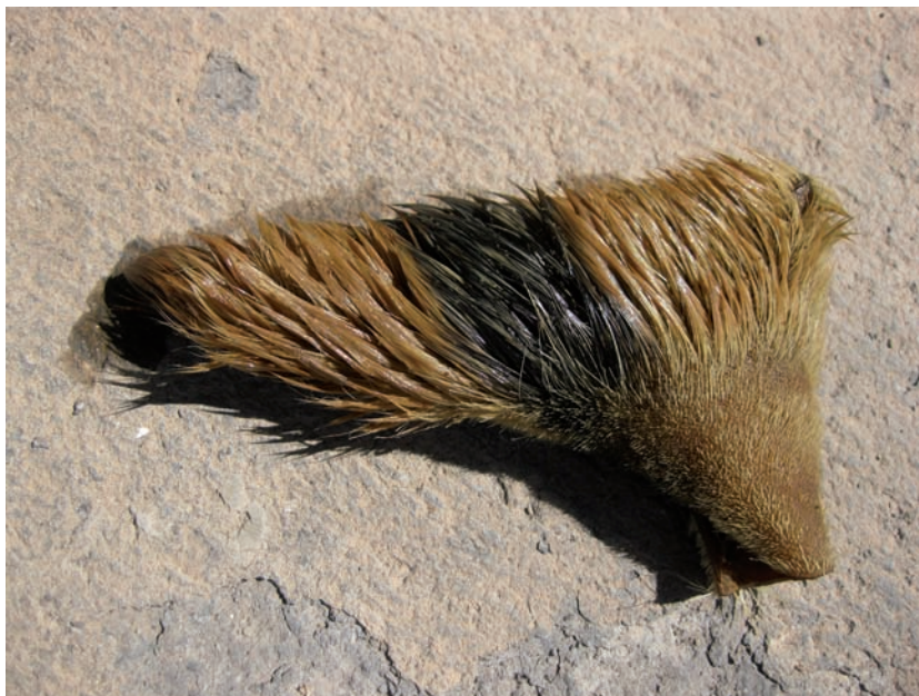
Fig. 2. Piel tintada con gualda. Obsérvese el tono amarillento.

Como era de esperar, solo con el agua caliente el proceso fue claramente satisfactorio. Hecho que coincide plenamente con los datos históricos y etnográficos consultados. Por el contrario, en frío los resultados no fueron significativos ya que no son perdurables. En general, si bien el tono amarillento resultante fue el esperado somos conscientes de que la intensidad también sería un factor importante por la importancia simbólica en el mundo aborigen de este color. Uno de los cuatro colores más importantes aún en el mundo bereber norteafricano que se puede apreciar aún hoy en día tanto en los tejidos como en el mundo de la orfebrería. En este sentido consideramos que podría ser un aspecto interesante para profundizar en su estudio. Fig. 2.