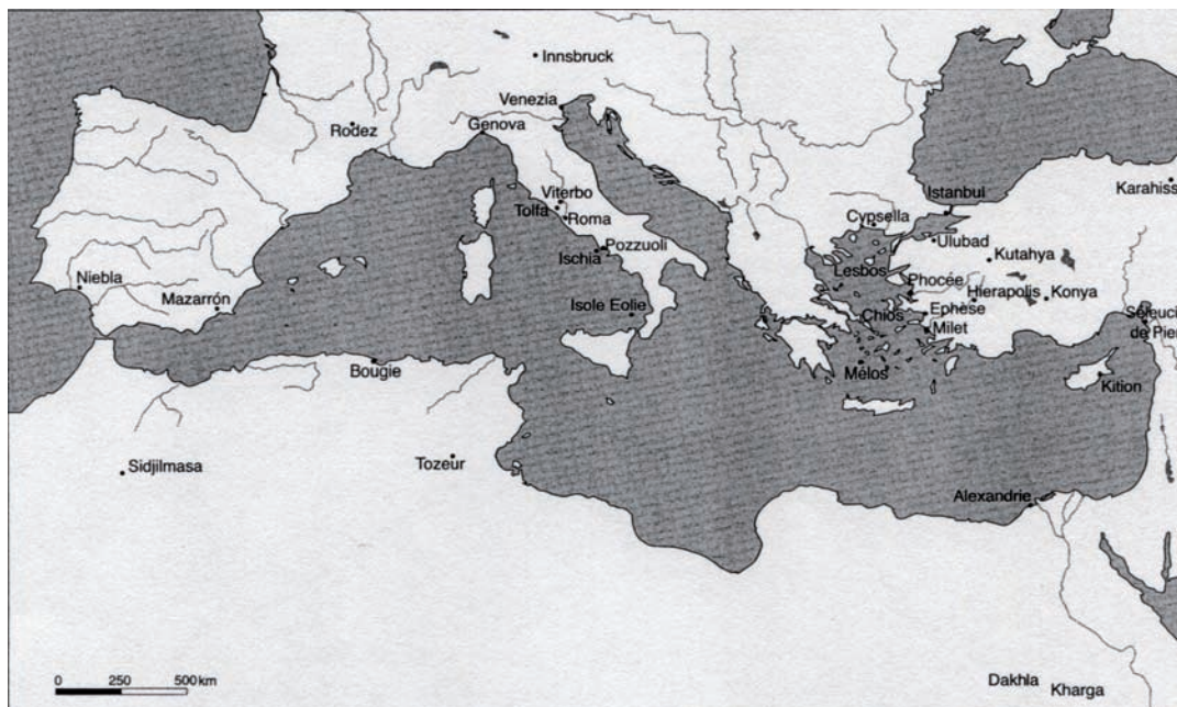
Fig. 5. Yacimientos de alumbre en el área mediterránea.

proceden de ellos, lógicamente nos hemos planteado la posibilidad de que lo usaran en Canarias en el caso de que dispusieran del mismo.