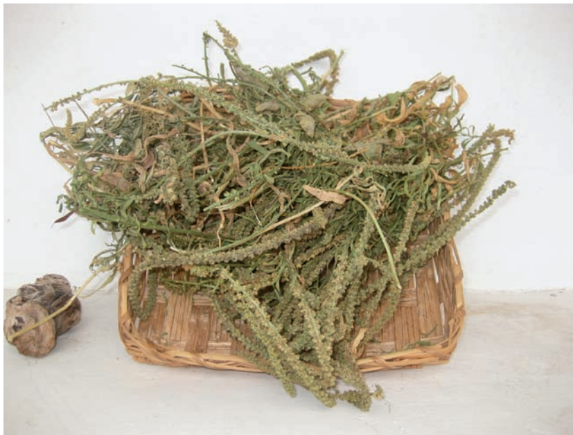
Fig. 1. Fase de secado de Reseda luteola L., la gualda.

Como era de esperar, solo con el agua caliente el proceso fue claramente satisfactorio. Hecho que coincide plenamente con los datos históricos y etnográficos consultados. Por el contrario, en frío los resultados no fueron significativos ya que no son perdurables. En general, si bien el tono amarillento resultante fue el esperado somos conscientes de que la intensidad también sería un factor importante por la importancia simbólica en el mundo aborigen de este color. Uno de los cuatro colores más importantes aún en el mundo bereber norteafricano que se puede apreciar aún hoy en día tanto en los tejidos como en el mundo de la orfebrería. En este sentido consideramos que podría ser un aspecto interesante para profundizar en su estudio. Fig. 2.