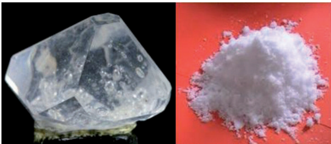
Fig. 6. Alumbre cristalino (izquierda) y calcinado (derecha).