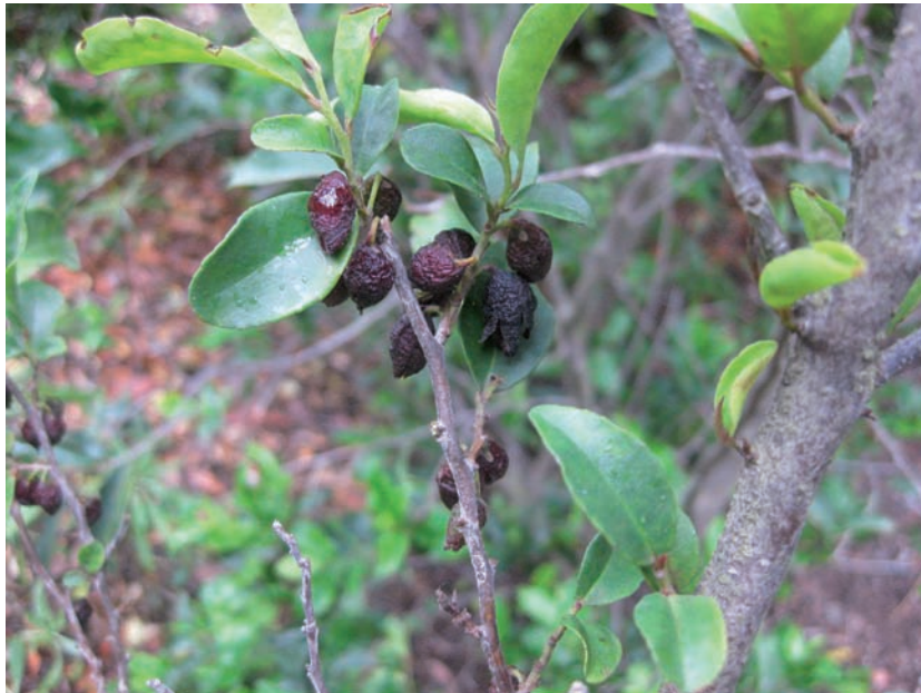
Fig. 3. Visnea mocanera L, especie de la que se obtendría el color marrón.

camaldulensis Dehnh. y E. globulus Labill) ha hecho que sea muy difícil obtener muestras sin posibles contaminaciones. Por otra parte, las características medioambientales tan particulares de Canarias hacen que casi todo el año puedan recolectarse especies del Reino Fungi. En este sentido las muestras durante la fase de campo se obtuvieron en la segunda quincena del mes de julio.