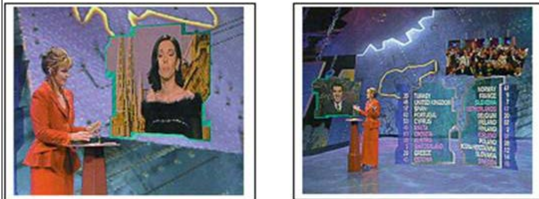
Ilustración 1. (Hughes, 1996)

1996. Festival de EUROVISIÓN en la NRK. La credibilidad de la integración. El estudio de este ejemplo tiene un extraordinario valor cualitativo porque es la primera apuesta solvente para la cobertura de un gran evento en directo con esta tecnología.