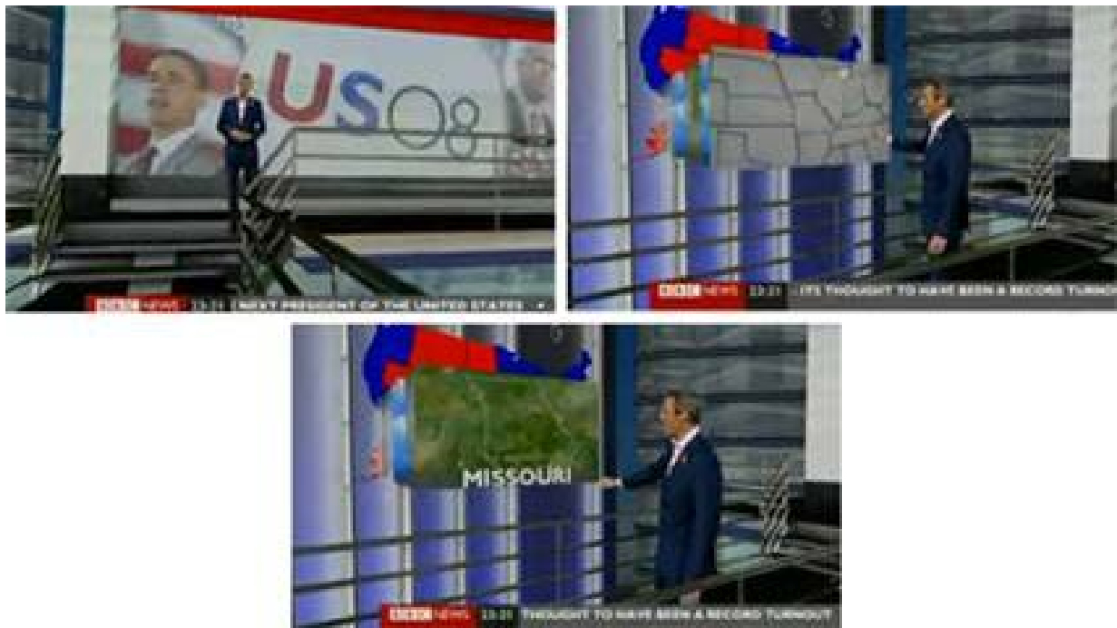
Ilustración 6.

2008. Especial elecciones BBC News. El virtual, escenario de una cita con la historia [4].