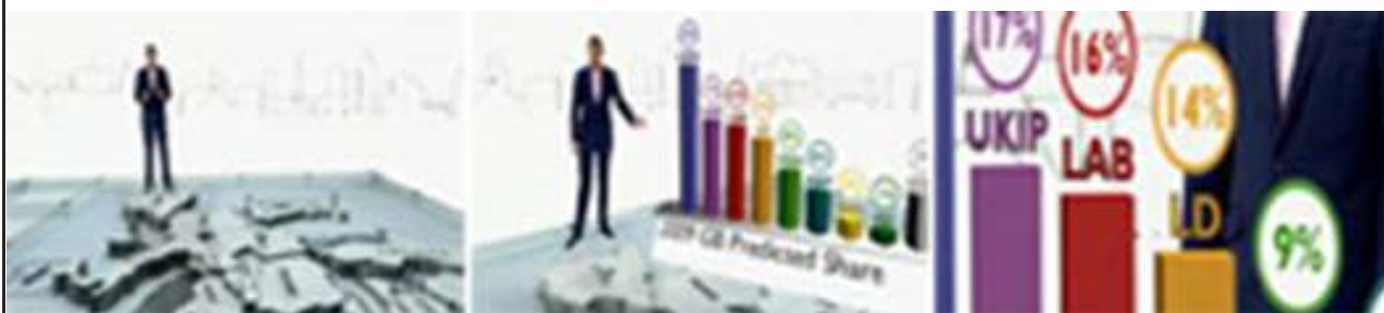
Ilustración 7.

BBC. ELECCIONES EUROPEAS 2009. La simplicidad ¿un síntoma de madurez?