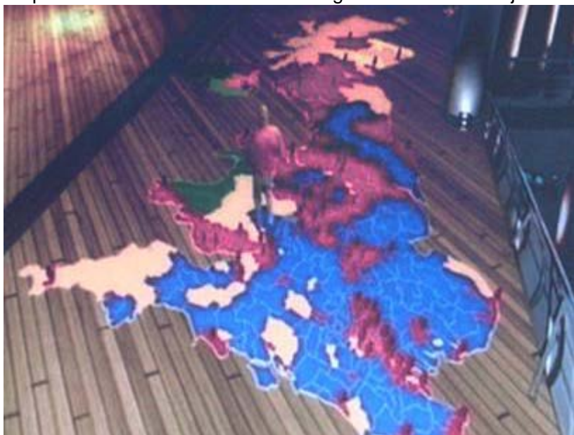
Ilustración 4. El presentador Peter Snow se pasea por un mapa virtual donde se representan los escaños.

2005. Especial Elecciones BBC. La escenografía virtual como eje central del guión del programa.