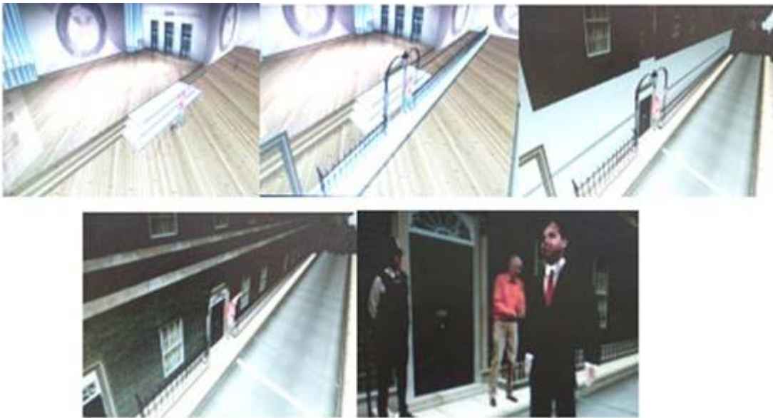
Ilustración 5. En esta secuencia de imágenes se observa la transformación que se produce a tiempo real entre el plató de televisión y la residencia del Primer Ministro británico en Downing Street, donde se representa una carrera entre los diferentes candidatos.

En este programa especial de elecciones, se llevaron a cabo una serie de recreaciones de espacios reales a través de entornos virtuales que servían al presentador para dar a conocer de una forma gráfica los datos de última hora [3]. La mayor dificultad del programa residía en la navegabilidad del presentador. Sin embargo, la implicación y complicidad del conductor Peter Snow con la tecnología y los numerosos ensayos que se llevaron a cabo facilitaron la comodidad del presentador con el entorno.