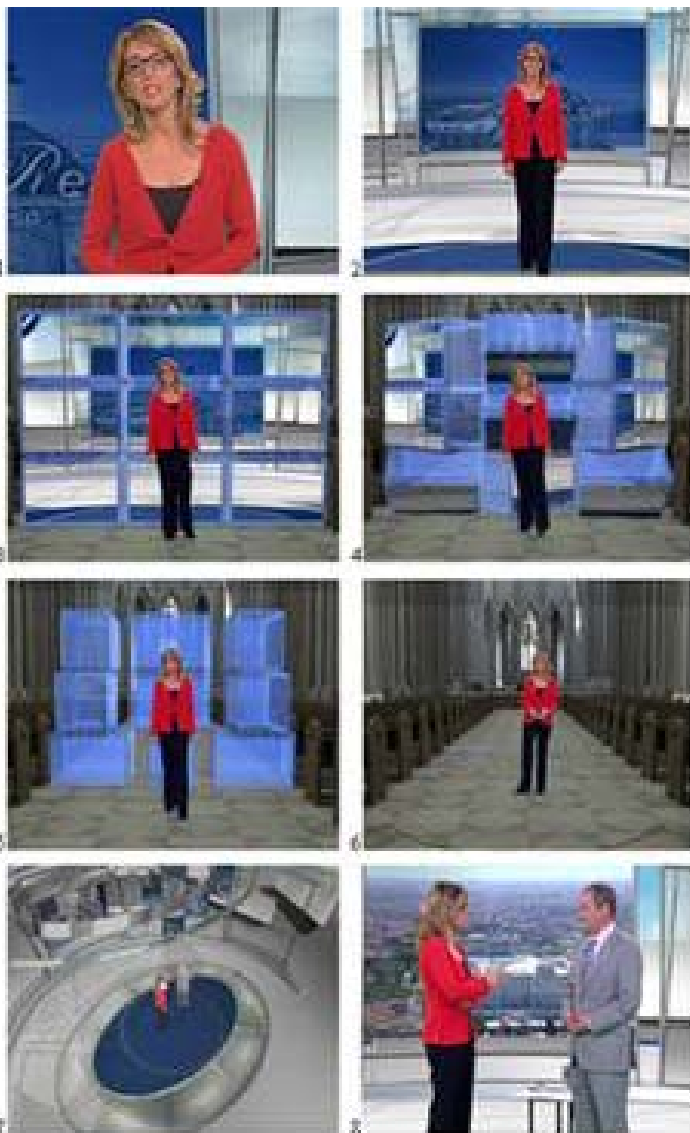
Ilustración 3.

Las imágenes que se muestran en la ilustración anterior corresponden al programa especial que TVE llevó a cabo en 2004 con motivo de la Boda Real de los Príncipes de Asturias. Se ha escogido este programa para llevar a cabo el análisis, porque es un excelente ejemplo de utilización de escenografía virtual con fines creativos.