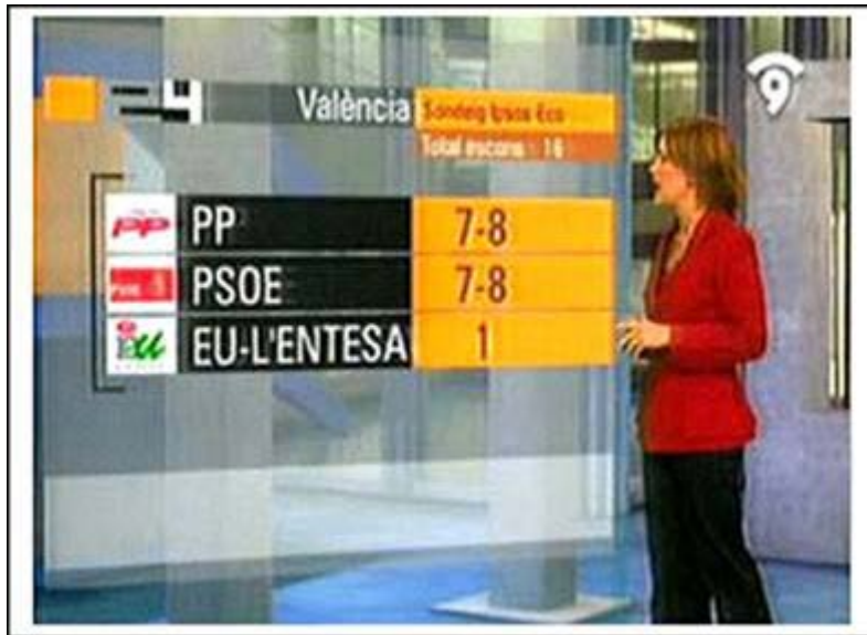
Ilustración 2.

En la imagen se observa cómo los datos se presentan en un plasma flotante y traslúcido. Pese a que el espectador detecta fácilmente que el decorado no es real, la forma de presentar la información resulta eficaz y elegante. El panel de datos no dispone de un soporte físico que justifique ante los ojos del espectador su origen real. Sin embargo, en la concepción del escenario no se rechaza de plano el uso de referentes reales. Para conferir mayor credibilidad al escenario se reproduce la configuración arquitectónica de un edificio real. El desafío se construye a través de fotografías desenfocadas –para simular la profundidad de campo– que dan mayor sensación de credibilidad.