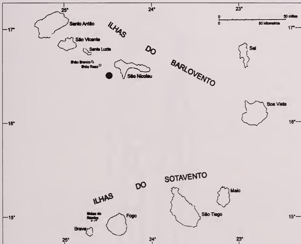
Figura 1.- Situación de la estación.

El espécimen procedía de una pesca diurna de código TFMCBM28C98D (vertical), llevada a cabo a las 11,15 horas del día 28 de septiembre de 1998 con una red triple WP-2 de 200 micras de luz de malla, desde mil metros de profundidad hasta la superficie (sin mecanismo de cierre). La estación de coordenadas 16^{\circ}30'00''\text{N} y 24^{\circ}26'54''\text{W} con fondos 1100 metros estaba situada frente a la isla de San Nicolau (NW de Cabo Verde). La fijación de la muestra se realizó con formalina al 5% (neutralizada) y los diferentes grupos taxonómicos fueron separados y contabilizados en su totalidad, sin obtener submuestras.