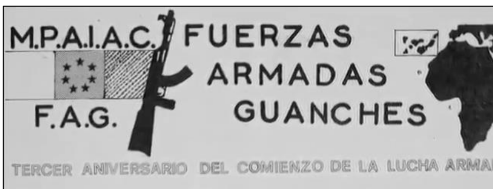
Propaganda del Mpaiaac a mediados de la década de 1970

«[1º] Se cobra así esta organización su primera víctima, aunque tenga ya en su negra historia la responsabilidad moral en el accidente de Los Rodeos...[2º] cuando fue a desactivar la bomba no pensó en nada. Ni en medallas ni en recompensas. Ni siquiera en el riesgo que estaba corriendo y en las consecuencias que todo aquello podría tener para sí y para su familia (...) Alguien, no recordamos quién, le habló de su imprudencia. Y él, con un brazo amputado y la muerte saliéndose por cuerpo, sólo pudo contestar que no había pensado en el riesgo. Sólo pensaba en que niños y mujeres podían resultar dañados por el artefacto... [y 3º] No valen excusas ante el cuerpo de un hombre joven amputado y muerto. Ante eso sólo valen acciones decididas (...) fuertes y bien pensadas (...) estas acciones terroristas lo que persiguen es hipotecar nuestro futuro, destruir nuestra seguridad, hacer inviable el tránsito a una democracia real, a una situación autonómica y siempre española».