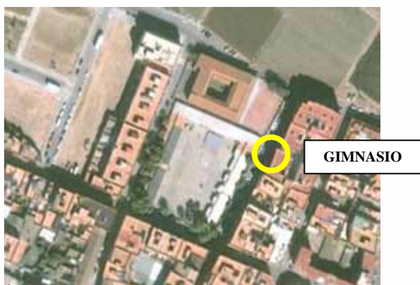
Figura 2. Vista aérea del colegio Mediterrani y la situación del gimnasio escolar.

Al norte de Meliana se encuentra el colegio público Mediterrani. Esta escuela ofrece la educación de los ciclos infantil y primaria, y fue la primera escuela de la comarca en ofrecer la enseñanza en lengua valenciana hace 25 años. Se compone de dos unidades claramente diferenciadas. Por una parte, el edificio escolar de dos plantas y un patio exterior que posee una extensión algo superior a un campo de fútbol sala. Por otra, el antiguo instituto Pío XII, en el costado sur. Este edificio actualmente alberga la Escuela de Adultos, aulas deterioradas por su desuso, el aula extraescolar de psicomotricidad y, utilizados por el Mediterrani, el patio y el antiguo gimnasio.