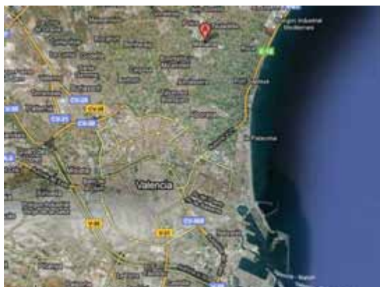
Figura 1. Vista aérea de Valencia y alrededores. Se percibe la distancia entre la capital y el municipio de Meliana y las otras localidades de la comarca.

El municipio de Meliana tiene una población algo superior a los 10.000 habitantes. Se encuentra en la comarca de l’Horta Nord, a 6 kilómetros al norte de Valencia y a 3 al oeste del mar Mediterráneo. Se trata de una zona extensa y llana de cultivos de chufa, arroz y hortalizas. Su presencia es enormemente visible junto a las alquerías y los canales de riego que se encuentran entre un pueblo y otro.