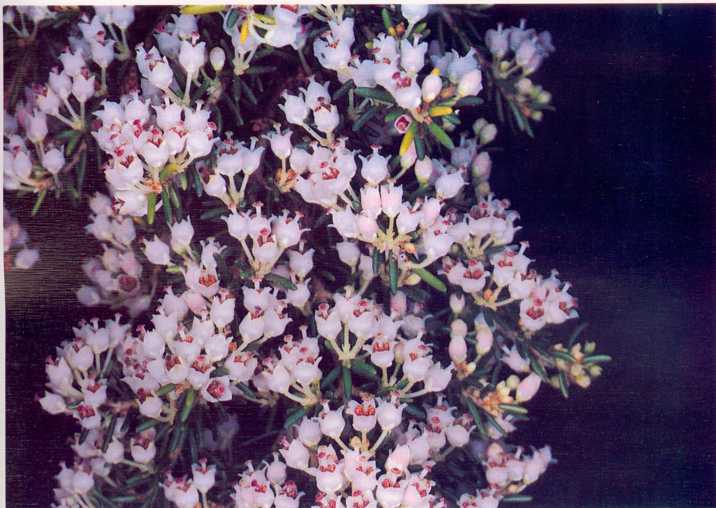
Familia: Ericaceae. Nombre común: Brezo.