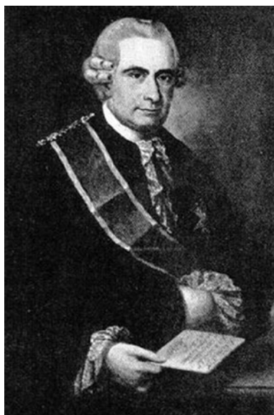
José de Gálvez y Gallardo.