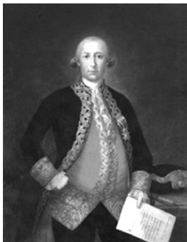
Bernardo de Gálvez y Madrid.