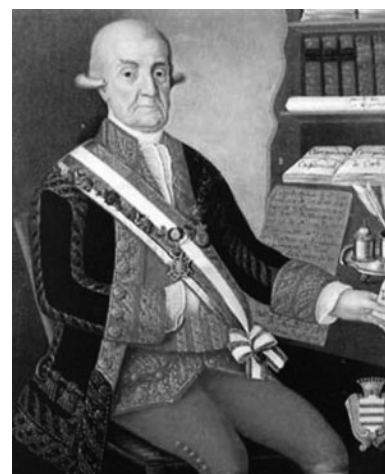
Miguel de Gálvez y Gallardo.