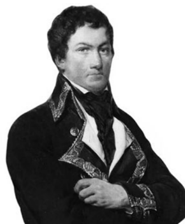
Francisco de Miranda.

He aquí el quid de la cuestión. Cagigal, fundamentándose en su conciencia y su obligación moral, consecuente con la falsedad de tales acusaciones, decidió no obedecer el mandato real. En sus propias palabras, «determinose a suspender el cumplimiento» y optó por remitir al Rey un informe sobre sus servicios. En él añadía que «no lo había sido menor la del General del Ejército de operaciones, el cual, por lo mismo, separándole del lado de mi parte lo había destinado al suyo propio y le tenía detenido allí para acabar de rectificar algunos de sus planos y mapas y que, fenecido este trabajo, pasase al Guárico». El propio