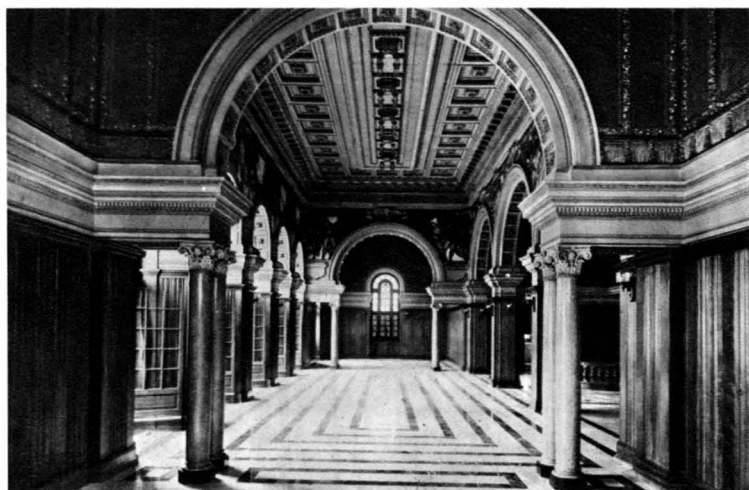
Teatro Pérez Galdós: Salón Saint Säens