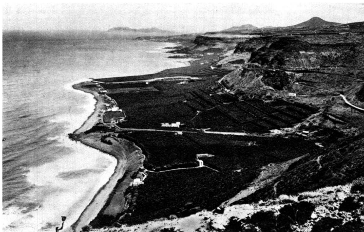
Cuesta de Silva y Vega de San Felipe