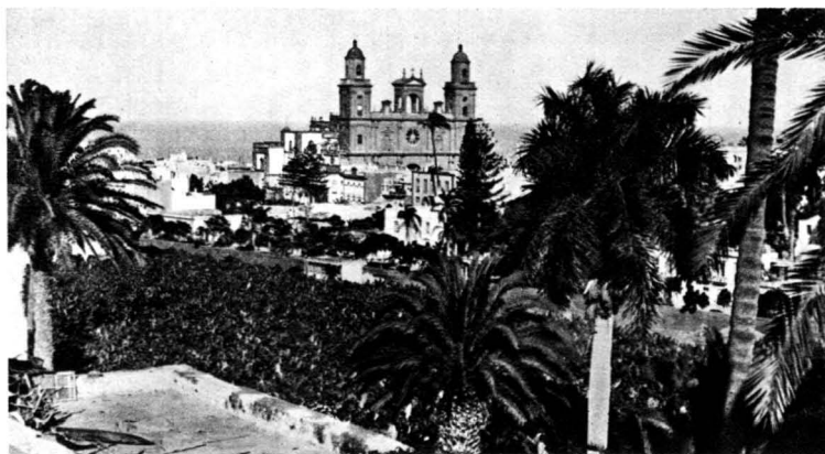
Vista parcial de Las Palmas