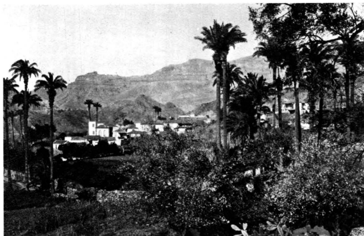
Paisaje del Valle Santa Lucía de Tirajana