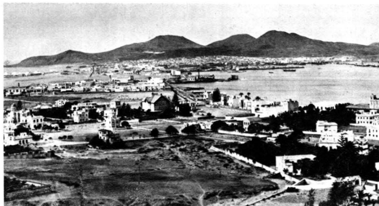
Ciudad Jardín y Puerto