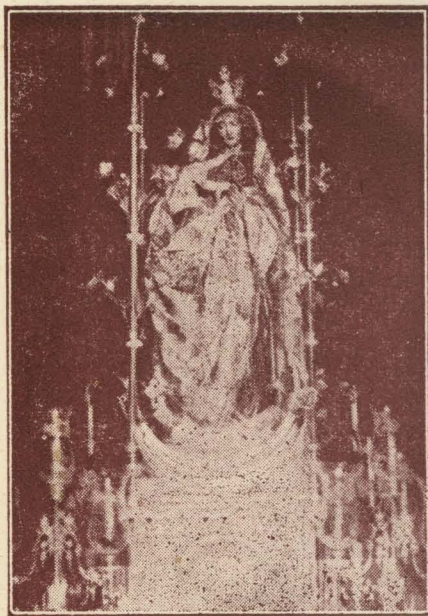
NTRA. SRA. DE LOS REMEDIOS Patrona del Valle