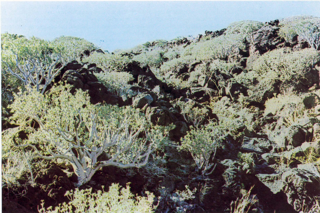
Foto 2. Vegetación natural en zona baja (Sur de Tenerife)