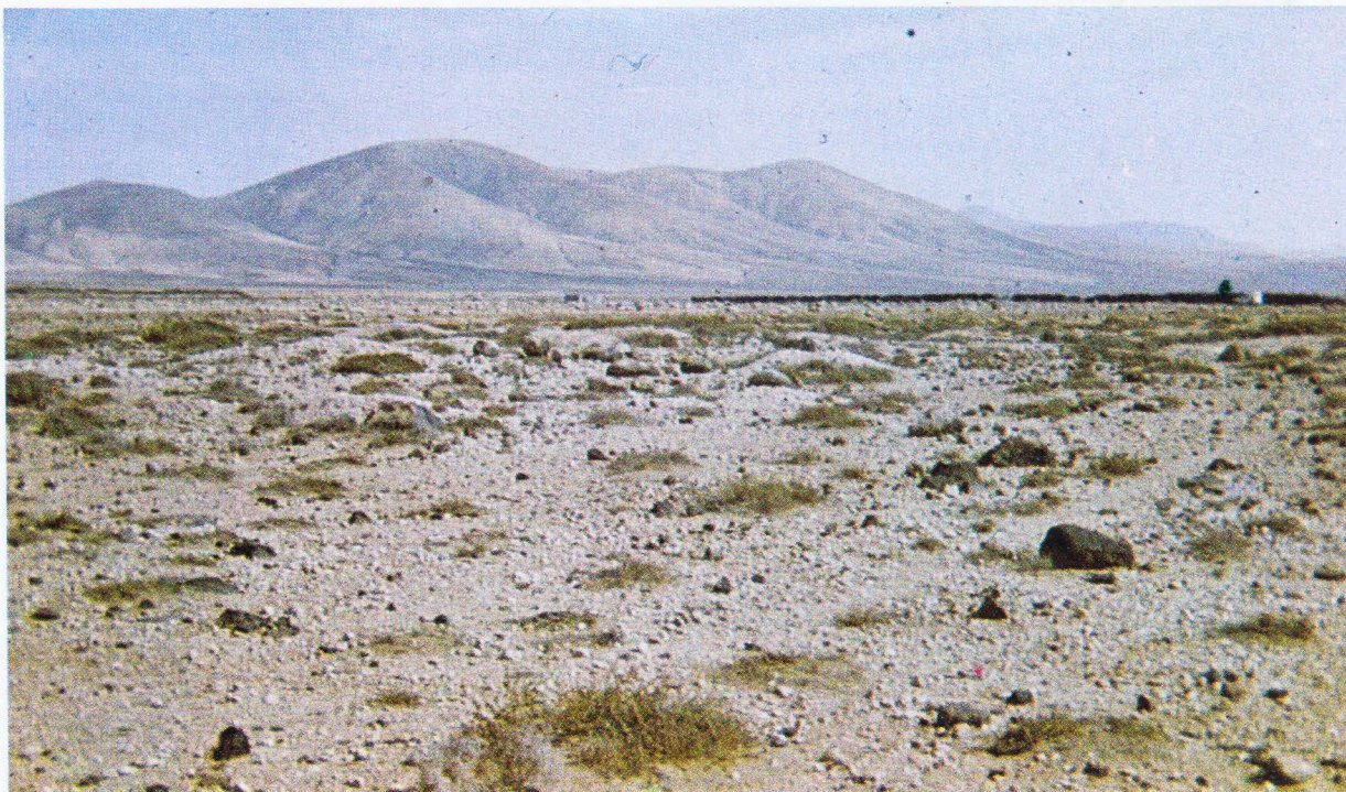
Foto 3. Llanuras y laderas de las islas orientales (Fuerteventura)