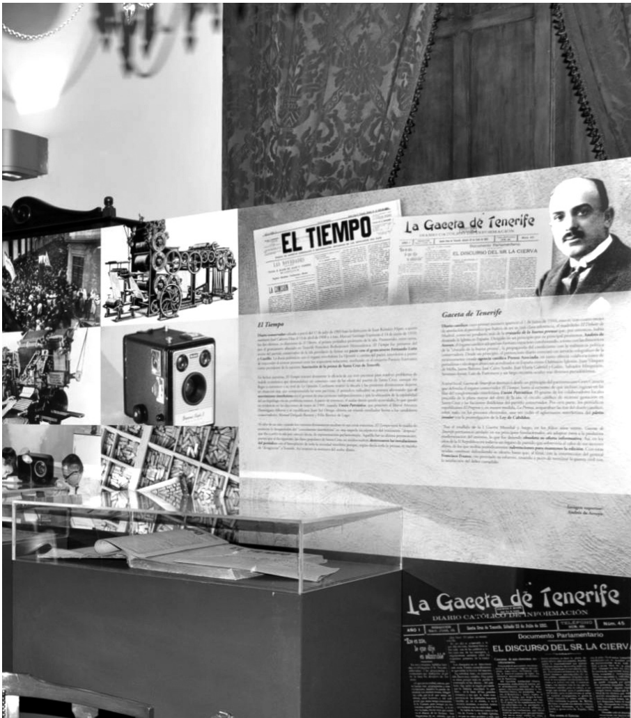
Vista parcial de los paneles situados en el Salón de la Ilustración