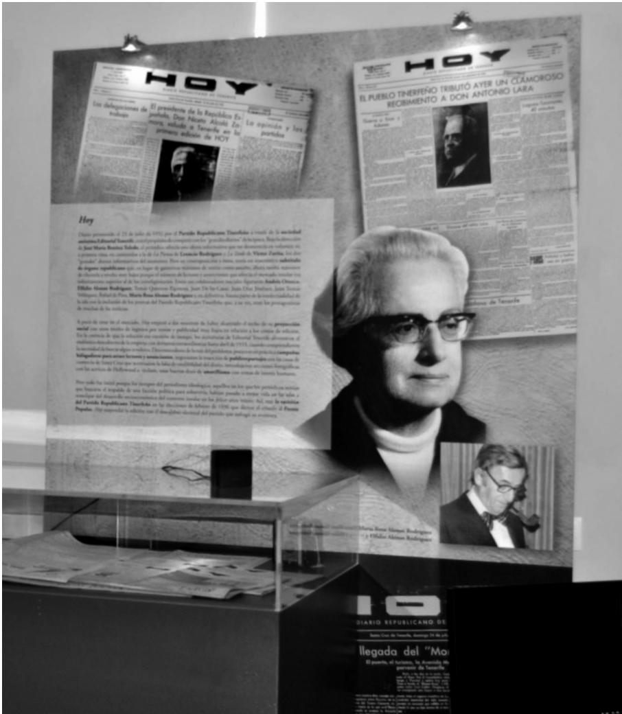
Detalle de uno de los paneles situado en el Salón de la Ilustración