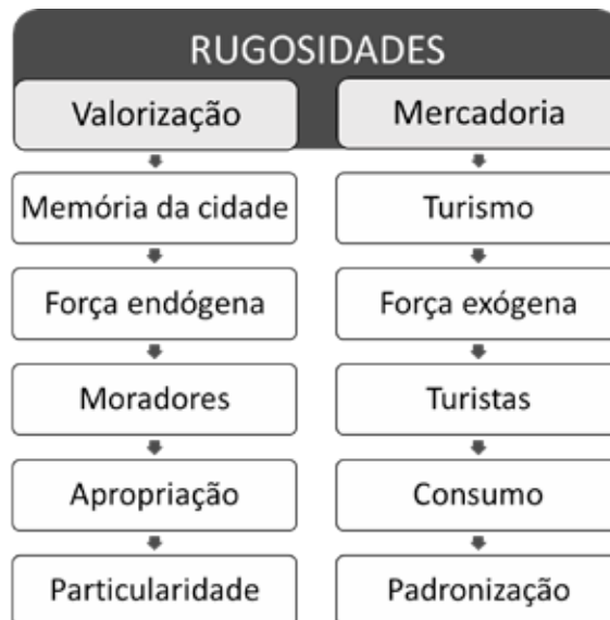
Figura 2: Categorias de análise das rugosidades e suas características

Em São Luiz do Paraitinga e Kiruna as transformações ocorreram nas materialidades, sobretudo localizadas no centro histórico do território urbano. Uma consequência de ações direcionadas unicamente ao atendimento das necessidades dos turistas (Santos, 2015). O mesmo foi evidenciado em Paraty (RJ),