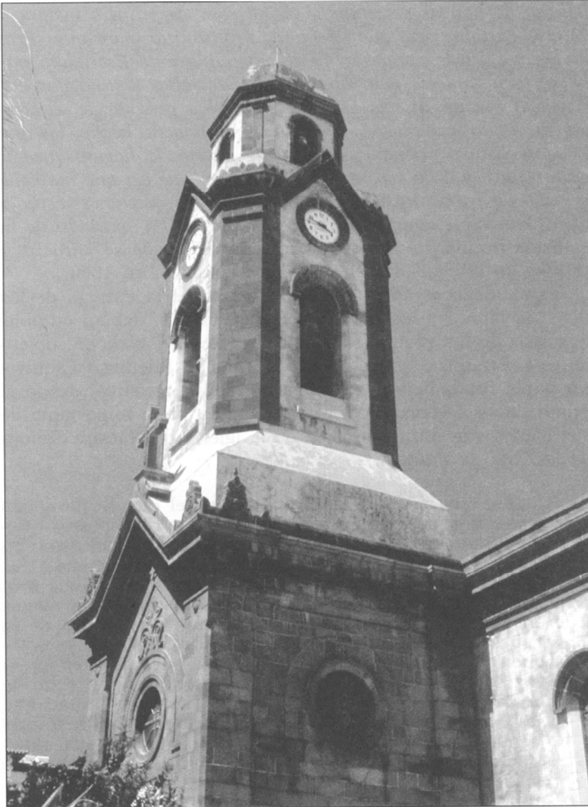
FIGURA 2.—Iglesia de Nuestra Señora de la Peña de Francia, Puerto de la Cruz, Tenerife. (Foto: Fernando Cova).