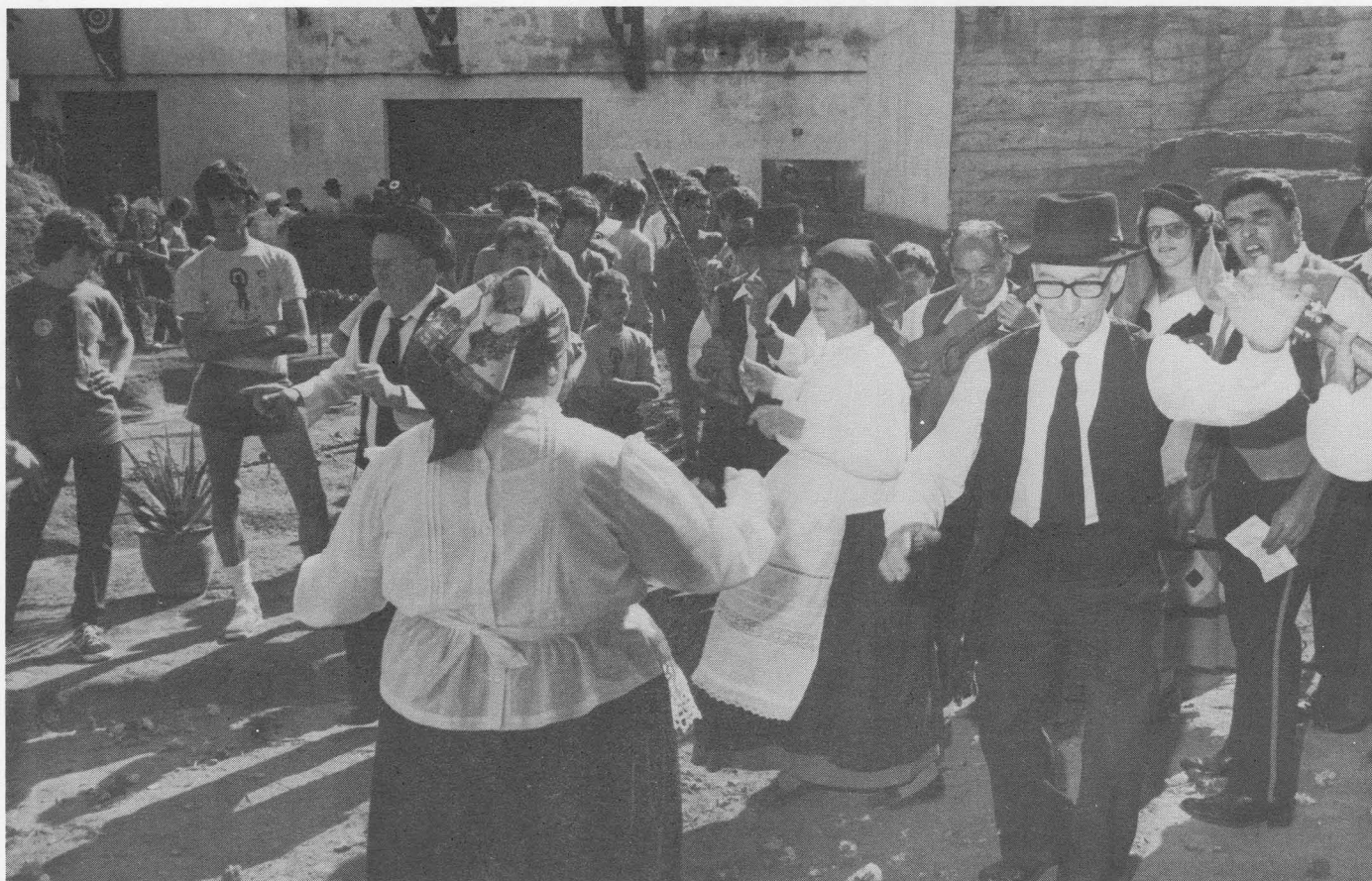
Durante la apertura del "Beñesmen – 80" actuaron los "Viejos de Gáldar"

"Me cabe la gran satisfacción de declarar inaugurados estos Juegos Deportivos y culturales con el nombre de Beñesmen. Al mismo tiempo hago entrega del gánigo, que es el máximo galardón existente en estos Juegos, al señor alcalde representado por su tenien-