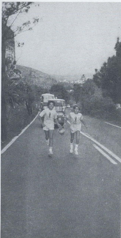
Entre Arucas y Tenoya, dos jóvenes corredores portan el gánigo del Beñesmen - 80

los guanartematos de Gáldar y Telde, de los grupos de Doramas o Bentaguai-re; de aquellos que vivían junto al Bentaiga, en los valles de Arehucas o en las playas de Arguineguín.