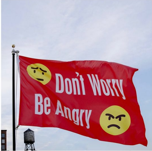
Jeremy DELLER Don't Worry Be Angry , 2017 Expuesta: Febrero 28 - Marzo 13, 2018