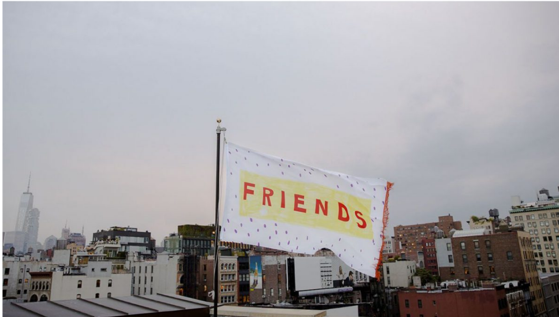
Alex DA CORTE Friends (for Ree) , 2017 Expuesta: Febrero 14 - Febrero 27, 2018