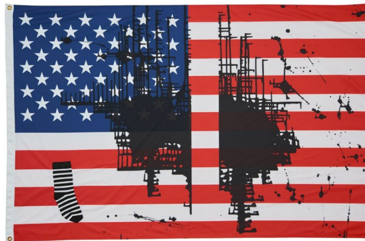
Josephine MECKSEPER Sin Titulo (Flag 2) , 2017 Expuesta: Junio 4 - Julio 31, 2018