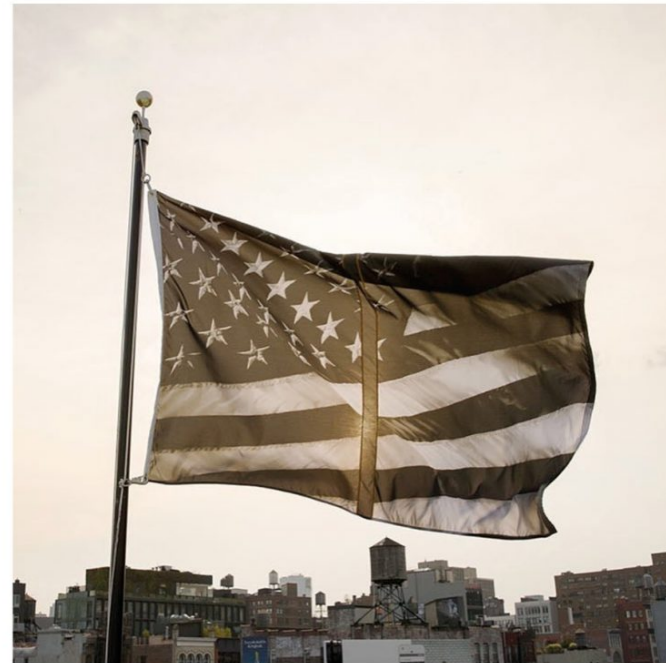
Robert LONGO Untitled (Dividing Time) , 2017 Expuesta: Septiembre 13 - Octubre 10, 2017