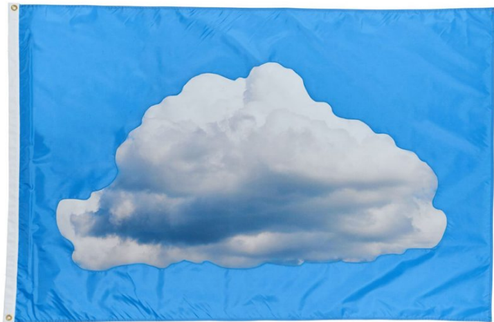
Vik MUNIZ Diaspora Cloud , 2017 Expuesta: Junio 6 - Julio 3, 2018