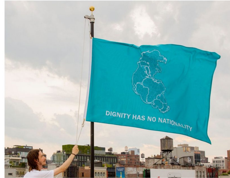
Tania BRUGUERA Dignity Has No Nationality , 2017 Expuesta: Julio 4 - Agosto 8, 2017