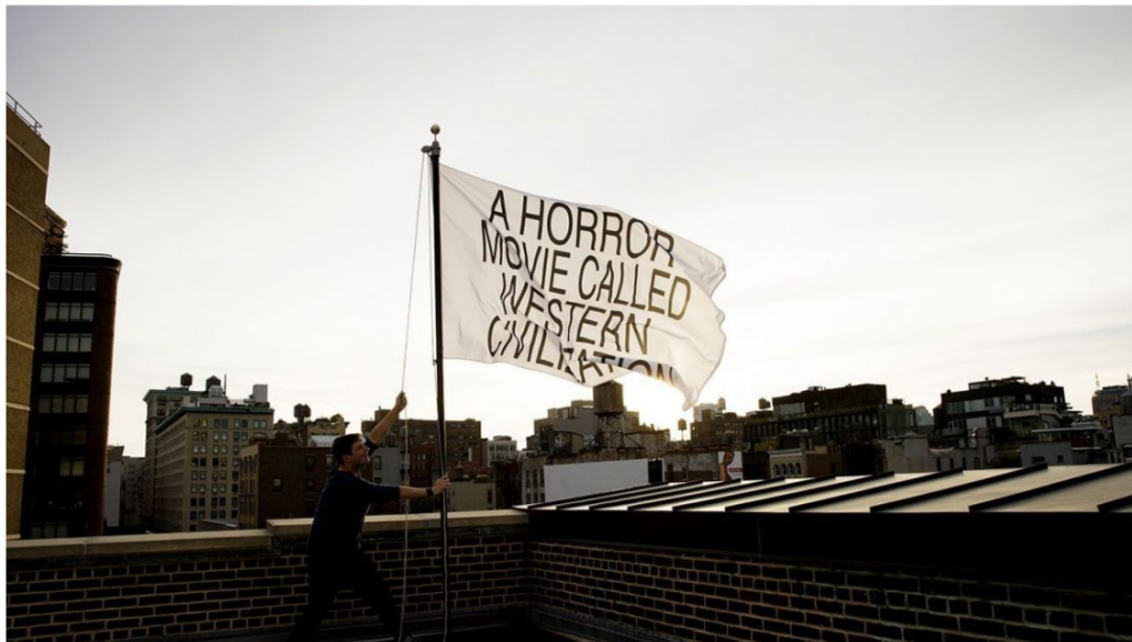
Jayson MUSSON A Horror , 2017 Expuesta: Octubre 11 - Noviembre 6, 2017