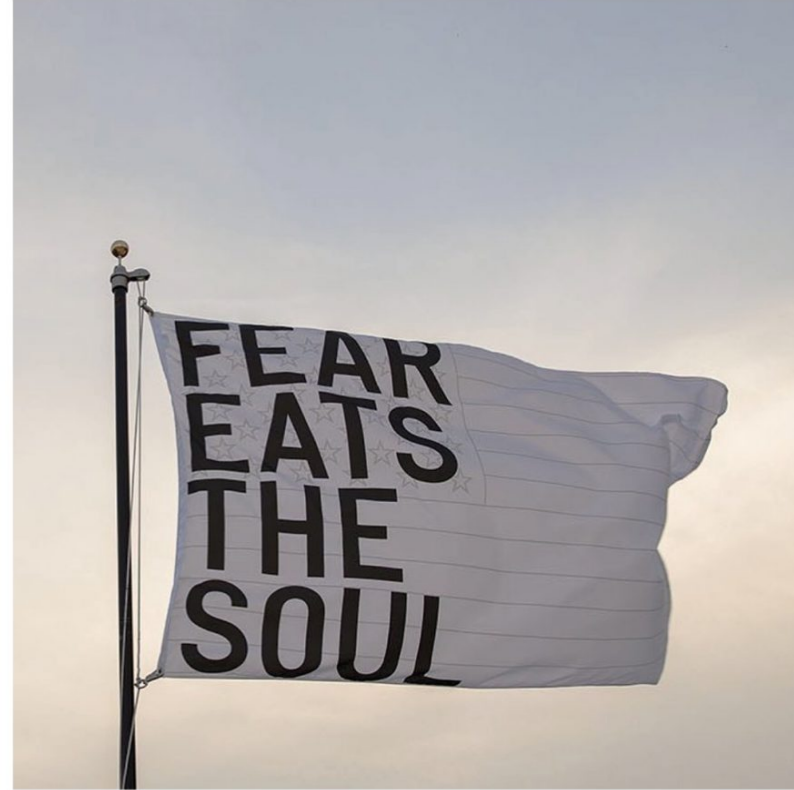
Rirkrit TIRAVANIJA Sin Título 2017 (fear eats the soul) (white flag) , 2017 Expuesta: Abril 4 - Abril 24, 2018