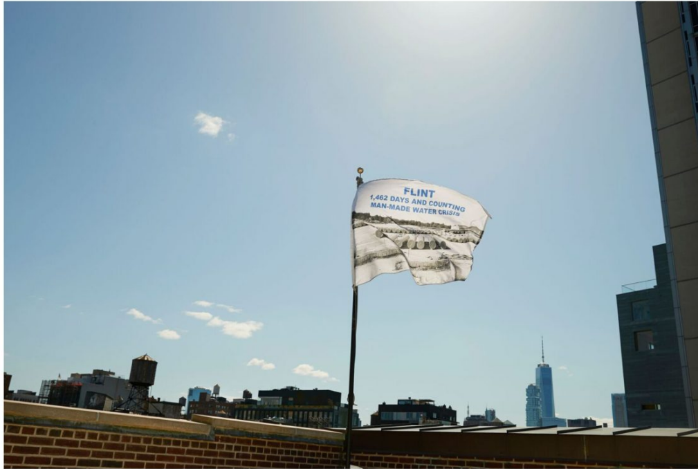
LaToya RUBY FRAZIER FLINT, 1,105 days and counting man-made water crisis, 2017 Expuesta: Abril 25 - Mayo 15, 2018