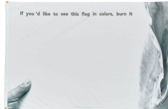
Ahmet ÖDÜT If You'd Like This Flag in Colors, Burn It (In memory of Marinus Boezem), 2017 Expuesta: Mayo 16 - Junio 5, 2018