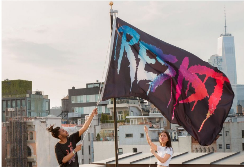
Marilyn MINTER Resist Flag , 2017 Expuesta: Junio 14 - Julio 3, 2017