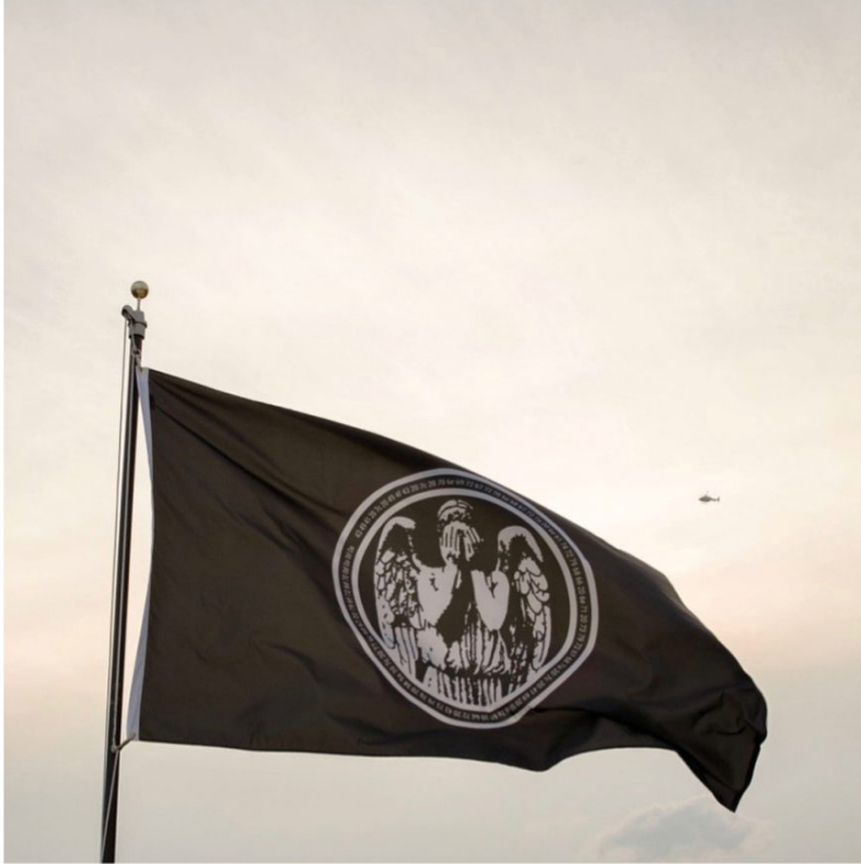
Trevor PAGLEN Weeping Angel , 2017 Expuesta: Marzo 14 - Abril 3, 2018