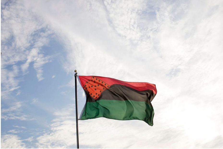
Nari WARD Breathing Flag , 2017 Expuesta: Agosto 14 - Septiembre 12, 2017