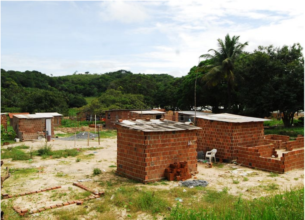
Figura 6. Fotografia das áreas de ocupação no entorno do Complexo SUAPE

Por outro lado, os operários e outros trabalhadores que não se incluem nos alojamentos corporativos, vêm acentuando uma ocupação desordenada das praias próximas ao complexo, sobretudo, com a instalação de habitações subnormais. A alta dos preços da terra, aliada a precariedade da infraestrutura urbana local confere um aspecto de degradação e “favelização” a essas áreas, conforme se verifica na fotografia seguinte.