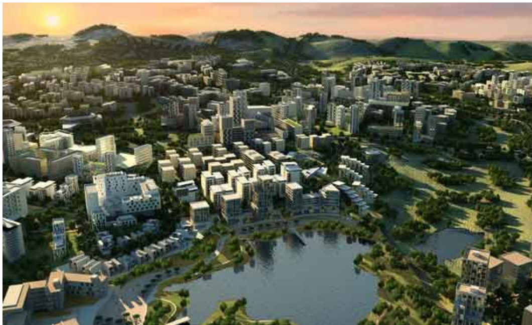
Figura 4. Imagem publicitária de bairro planejado na área de SUAPE