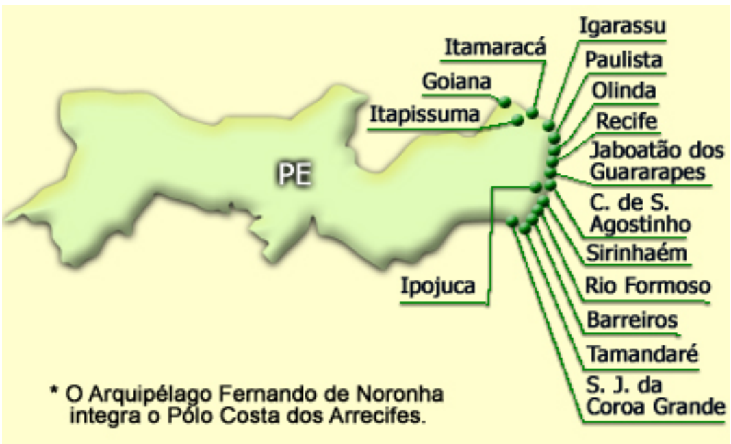
Figura 1. Pólo Costa dos Arrecifes – PRODETUR/NE I