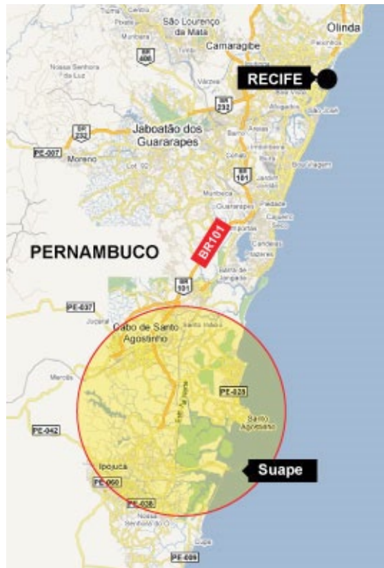
Figura 3. localização do Complexo SUAPE

Nesse contexto, foi criado na segunda metade da década de 1970 o Complexo Industrial Portuário de Suape (CIPS) 9 , situado na nucleação Sul da Região Metropolitana do Recife, distante cerca de 40 quilômetros do Recife, com acesso a partir da BR – 101 e da PE – 60, e com 61% de sua área no município do Cabo de Santo Agostinho e 30% em Ipojuca. A área destinada ao Complexo abrange a faixa litorânea entre o rio Jaboatão e a praia de Porto de Galinhas, compreendendo parte dos municípios de Cabo e de Ipojuca, conforme se verifica na figura seguinte.