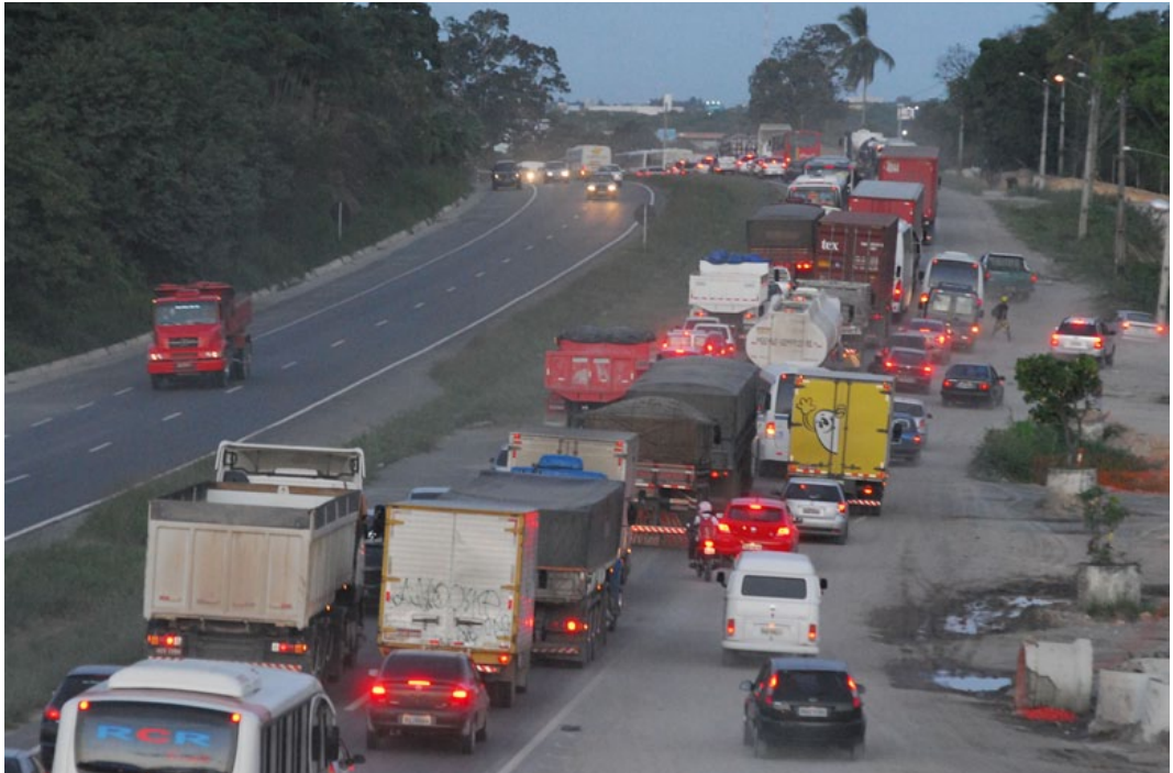
Figura 7. Fotografia dos acessos a Porto de Galinhas e do Complexo de SUAPE

Essas mudanças incorporam ao território marcas de uma economia de caráter muito mais urbana, que se orienta pela força do Complexo Portuário, e muito menos pelo turismo que até alguns anos atrás “determinou” a configuração territorial de Ipojuca/Porto de Galinhas.