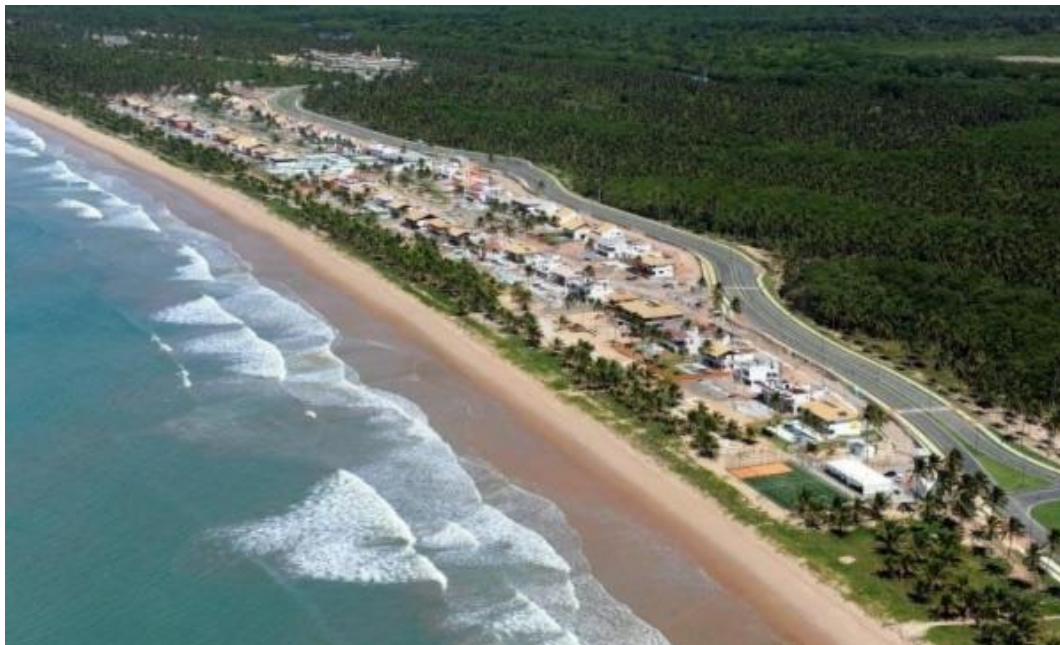
Figura 5. Fotografia área do Condomínio Reserva do Paiva