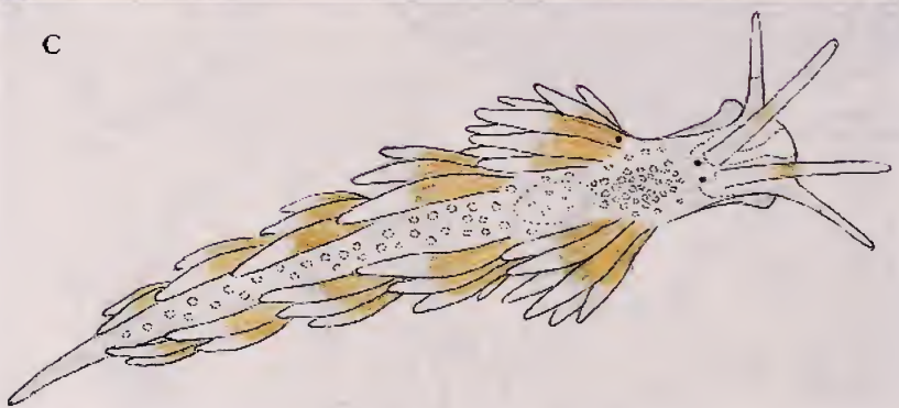
Lámina 1.- Catriona maua Marcus & Marcus, 1960. A. Ejemplar de Cabo Verde; B. Ejemplar de Canarias; C. Catriona tema Edmunds, 1968, ejemplar de Cabo Verde.