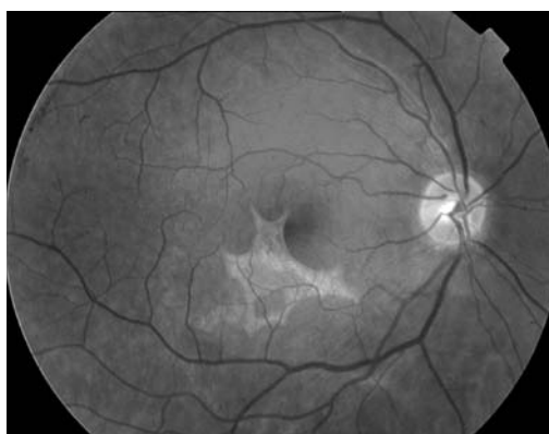
Fig. 2: Desaparición de la hemorragia subretiniana y presencia de lesión cicatricial.