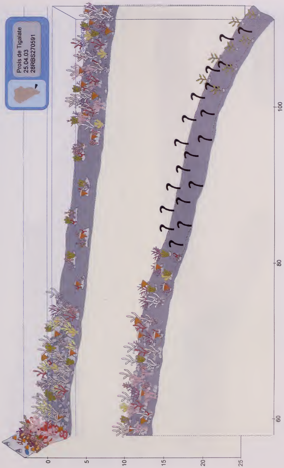
Fig. 2. Profs de Tigalate. Esquema del perfil del litoral con la zonación de las especies dominantes.