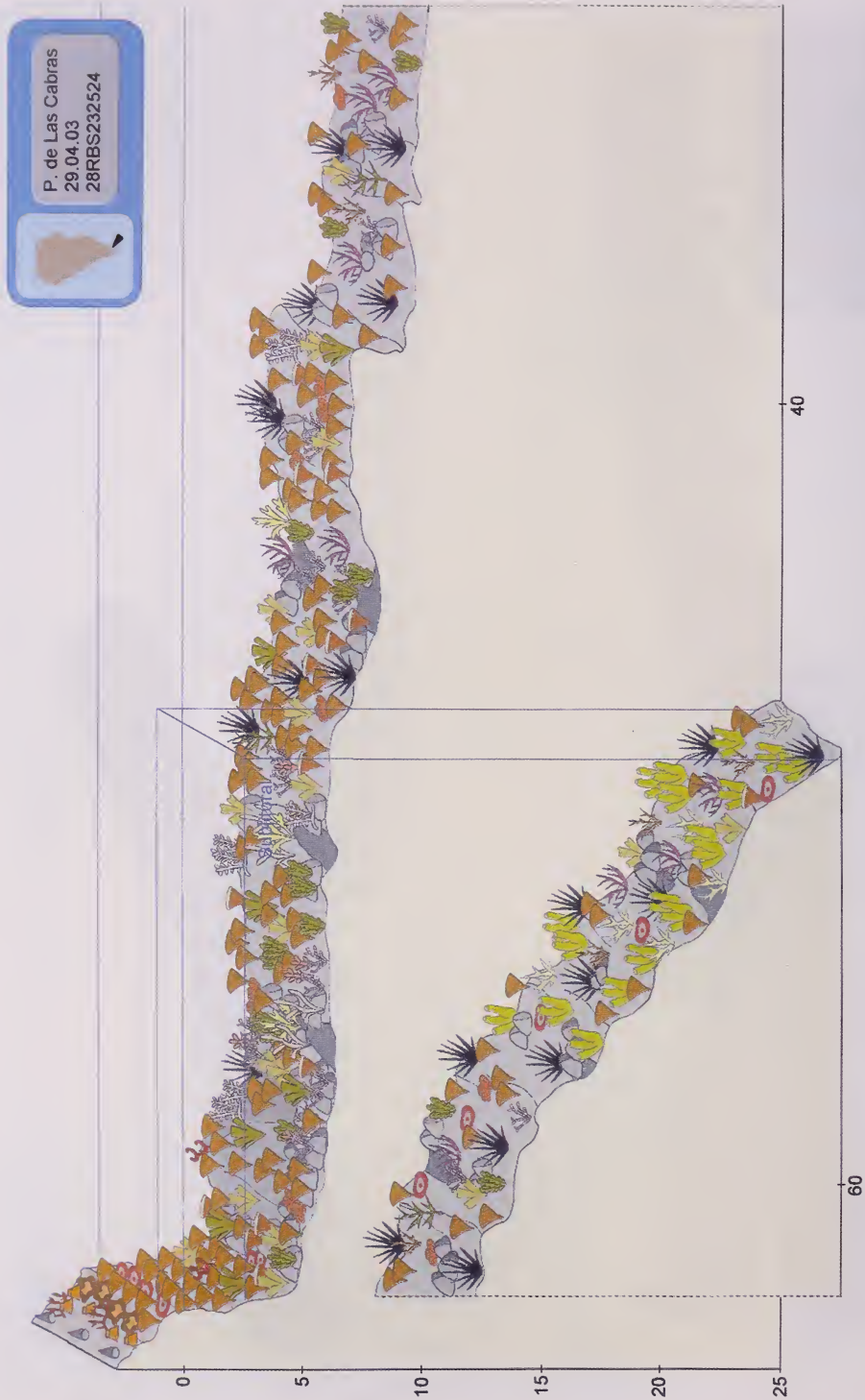
Fig. 5. Playa de Las Cabras. Esquema del perfil del litoral con la zonación de las especies dominantes.