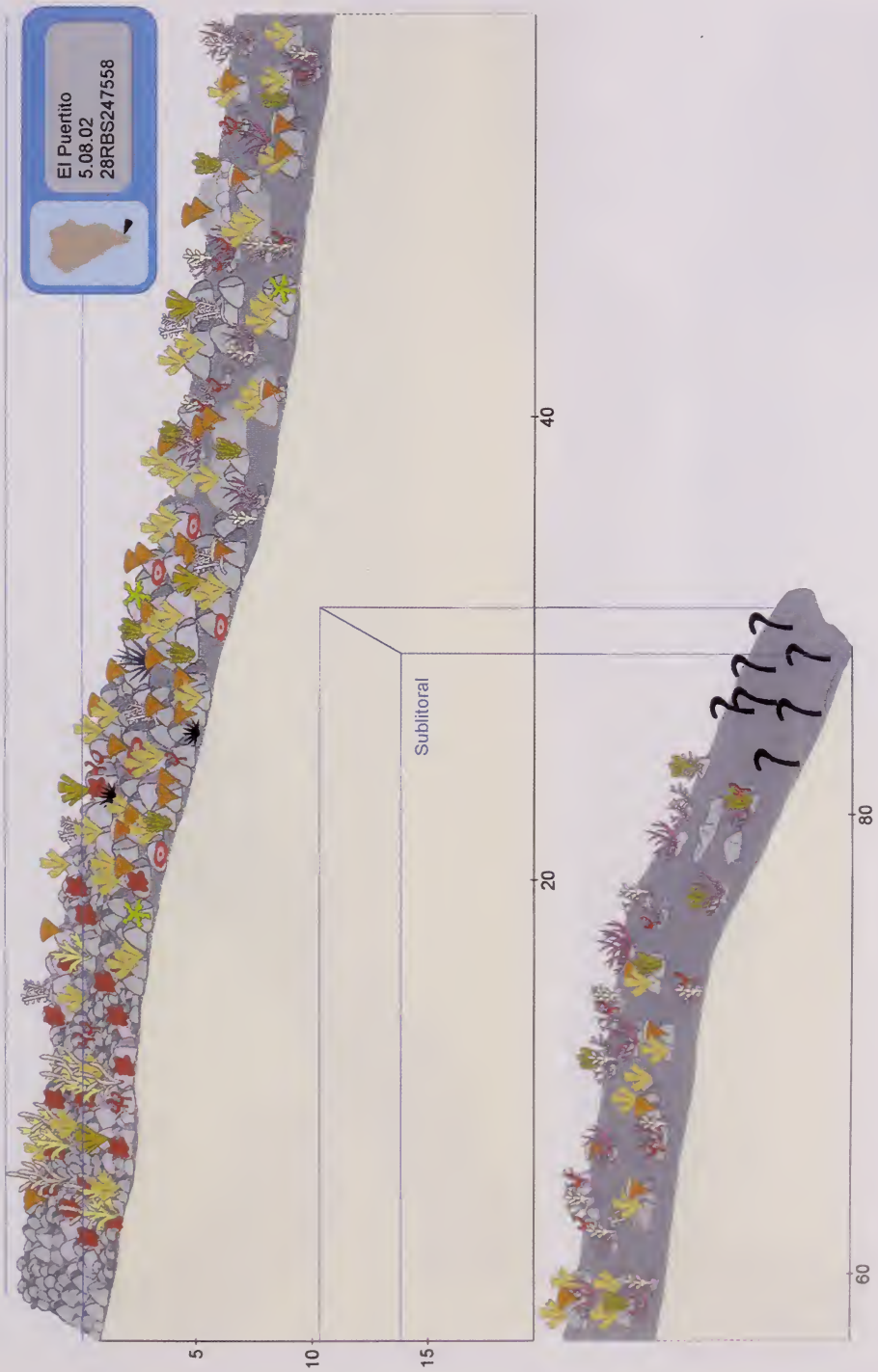
Fig. 4. El Puertito. Esquema del perfil del litoral con la zonación de las especies dominantes.