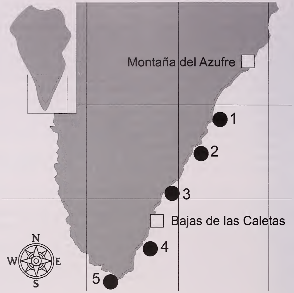
Fig. 1. Localidades donde fueron realizados los transectos. 1. Proís de Tigalate. 2. Playa del Río. 3. El Puertito. 4. Playa de Las Cabras. 5. Punta de Fuencaliente