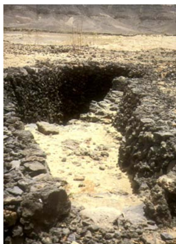
Fig. 6. Pozo con dromos escalonado del ‘Puerto de los jardines’ en Pozo Negro (Antigua).