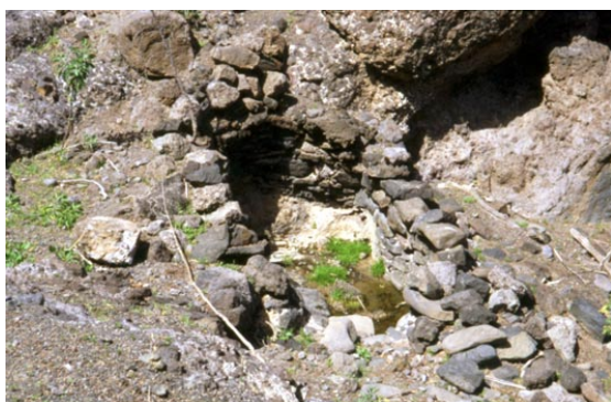
Fig. 3. Fuente de Rico Roque o fuente de ‘Rocha’ en el Barranco de Pozo Negro (Antigua, Fuerteventura).