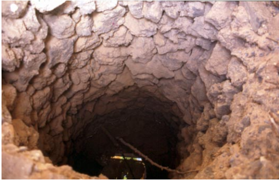
Fig. 7 Uno de los pozos circulares del “Puerto de los jardines” en Pozo Negro (Antigua)