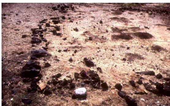
Fig. 5. Detalle de las estructuras localizadas en la desembocadura del barranco de Pozo Negro (Antigua). Posible emplazamiento del ‘Puerto de los Jardines’.