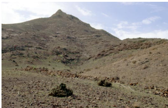
Fig. 1. Vista de El Tablero de El Saladillo, en la margen derecha del Barranco de Pozo Negro, donde se ubica la fuente y el Castillo de Rico-Roque (Antigua).

ubicadas en la desembocadura de Pozo Negro; pero como todo esfuerzo lleno de tesón e inteligencia, éste tampoco fue en vano, ya que su descubrimiento de la fuente de Rocha -o Rico Roque- y su perspicacia de creer que Pozo Negro podría tratarse en realidad del Puerto de los Jardines, nos ha permitido confirmar que lo hallado por nosotros estaría asociado con los primeros testimonios europeos en esta costa de Fuerteventura, pertene-