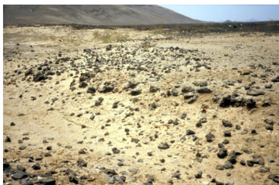
Fig. 4. Restos del emplazamiento probable del ‘Puerto de los jardines’ en la desembocadura del barranco de Pozo Negro (Antigua).