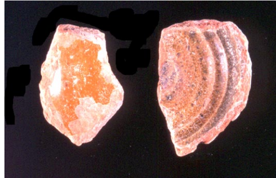
Fig. 8 Cerámica melada de Fuerteventura