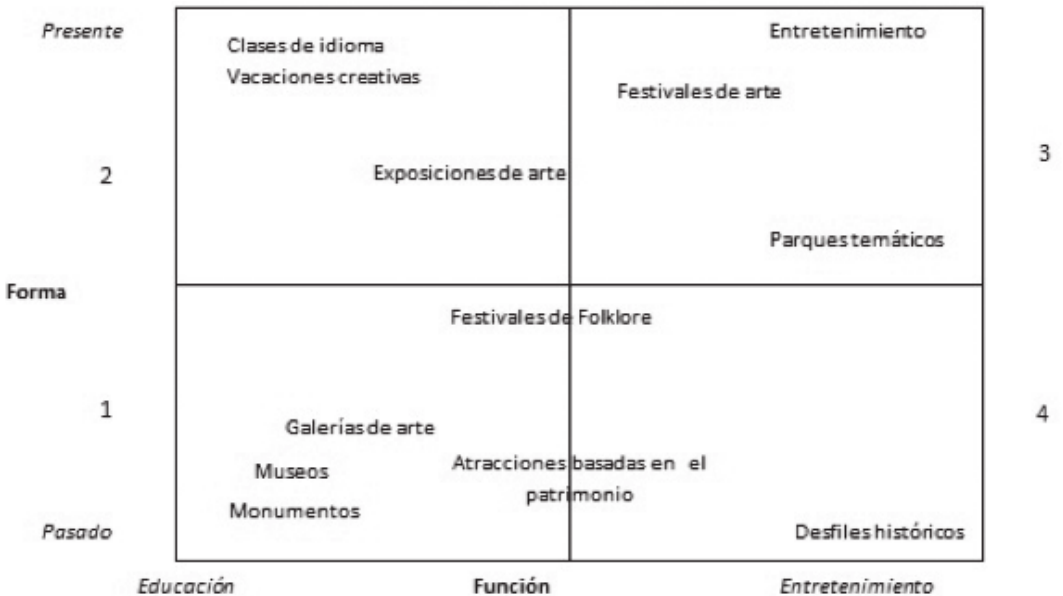
Figura 1. Tipología de turismo cultural según Richards (2001)

Así destacamos la importancia de los eventos y festivales, generalmente más asociados a ocios populares, y utilizados por los destinos, cada vez en mayor medida, para atraer a los consumidores. La promoción de los eventos y festivales en este sentido esta “cada vez más dirigida a objetivos sociales que económicos” (Richards, 2006, pág.277).