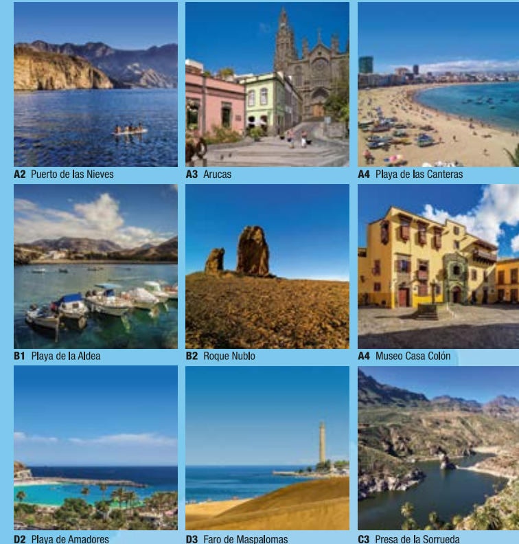
A B1 Playa de la Aldea B2 Roque Nublo C1 Preisa de la Somorria B3 Faro de Maspalomas C2 Playa de Amadores C3 Faro de Maspalomas