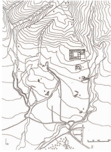
1. Βεργίνα. Τοπογραφικό σχέδιο. 1: θέατρο, 2: ανάκτορο, 3: ιερό Εὐκλείας - αγορά, Drougou, 1997: 300-301.

χρονολογείται στο β' μισό του 4 ου αι. π.Χ., εποχή δημιουργίας στον ελληνικό κόσμο των παλαιότερων λίθινων θεάτρων (Δρούγου, 1999: 28· Δρούγου, 2017: 92-93, 97-98· Δρούγου - Καλλίνη, 2014-2015: 494, 506). Παράλληλα, γειτονεύει ακριβώς βόρεια με την πολιτική αγορά της πόλης προς την οποία είναι προσανατολισμένο 7 (Drougou, 1997: 282). Βασική ιδιομορφία του κοίλου είναι η ύπαρξη της πρώτης και μοναδικής λίθινης σειράς εδωλίων ενώ στη συνέχεια αναπτύσσεται χρησιμοποιώντας τη φυσική πλαγιά. Επιπλέον, το δεδομένο της ακατάλληλης γεωμορφολογικά θέσης για μια τέτοια κατασκευή σύμφωνα με τις αρχαίες πρακτικές, υποδεικνύει ότι ειδικοί λόγοι επέβαλαν τη συγκεκριμένη επιλογή, κυρίως για τη διασφάλιση τοπογραφικής και λειτουργικής σχέσης του θεάτρου με το ανάκτορο και την αγορά. Σε αυτό συνηγορούν οι αρχιτεκτονικές ιδιομορφίες που παρουσιάζει, ορισμένες από τις οποίες, πιθανόν, διευθετήθηκαν με τεχνικές λύσεις για την προσαρμογή του στο φυσικό ανάγλυφο. Φαίνεται, λοιπόν, ότι το ανάκτορο και το θέατρο αποτέλεσαν ένα ενιαίο αρχιτεκτονικό σύνολο (Nielsen, 1994: 81) που συγκέντρωσε τις βασιικές λειτουργίες της βασιλικής κατοικίας και της πόλης. 8