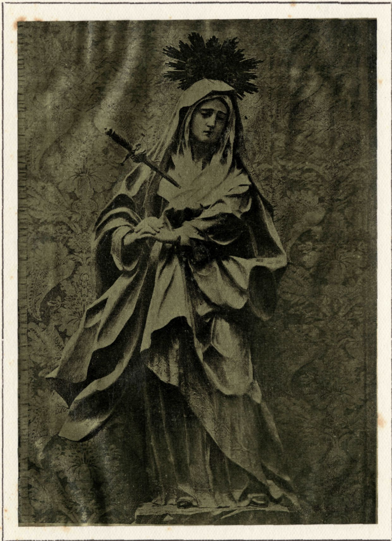
Dolorosa de la Catedral