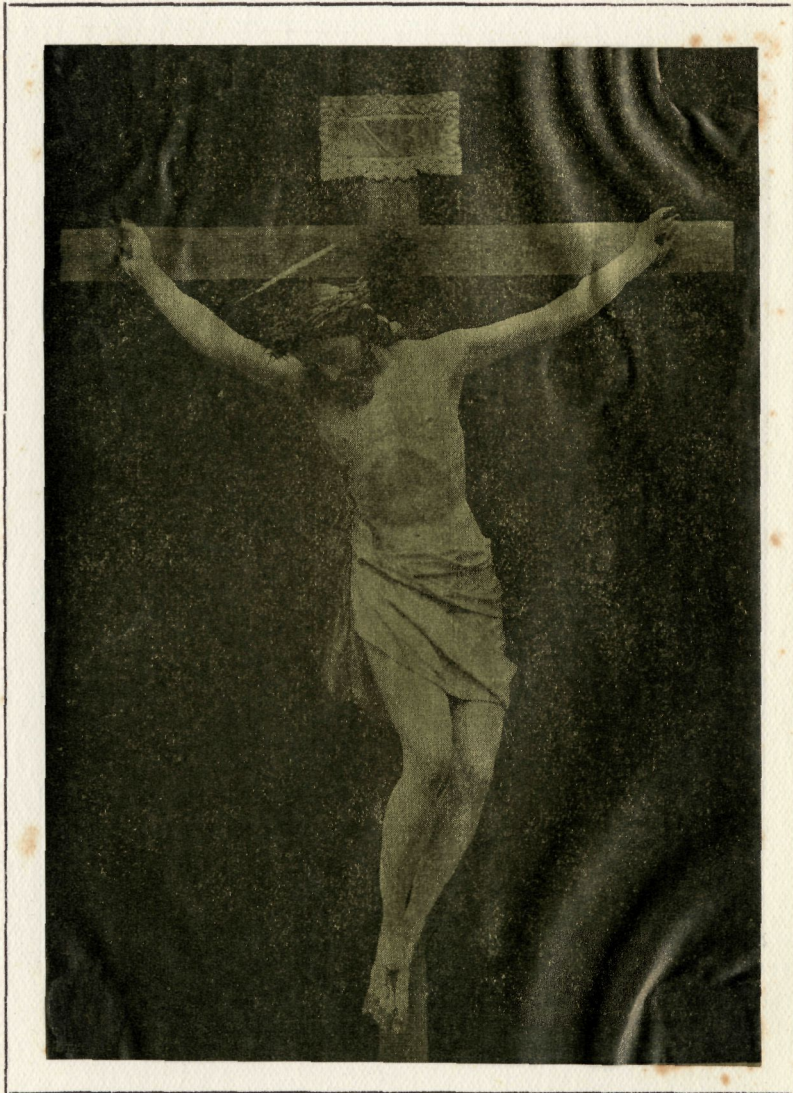
Cristo de la Sala Capitular