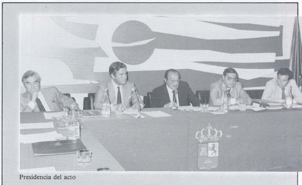
Presidencia del acto