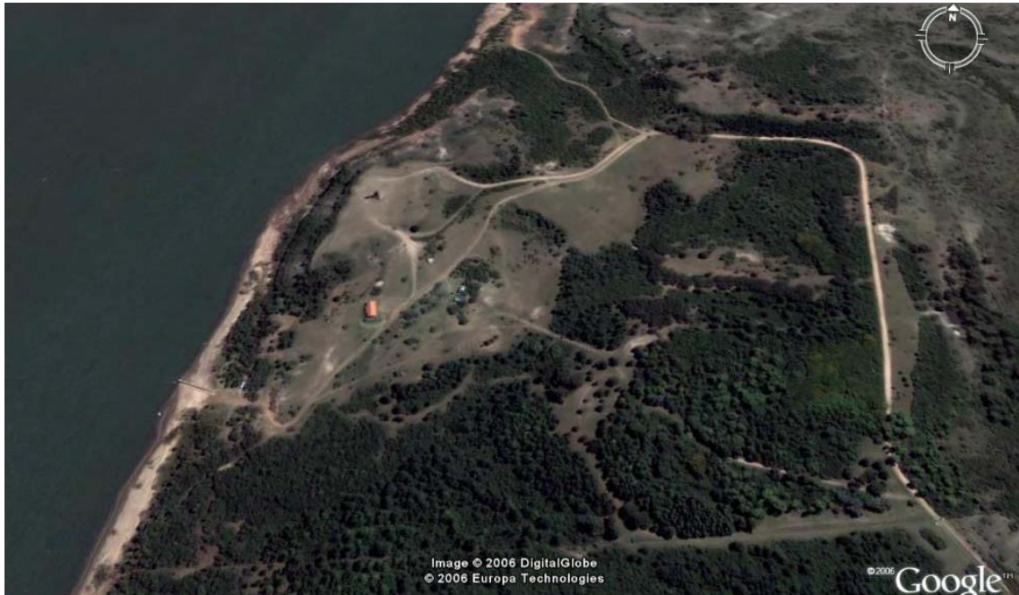
Monumento Histórico Meseta de Artigas

estaríamos haciendo un aporte ya que hasta ahora solo se ha planteado la idea del sendero, pero nos sus condiciones técnicas. Sendero que debería de comenzar desde un Centro de Visitantes (a construirse también) ubicado en Meseta de Artigas, que utilice el trillo bordeando el Río Uruguay propuesto por Stagno, llegue al memorial (a construirse) en el monumento histórico Cuartel General de Artigas y villa Purificación y retorne al Centro de Visitantes.