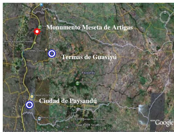
Ubicación del Monumento Histórico Meseta de Artigas en el Departamento de Paysandú (derecha)

En la Meseta se desarrollan además importantes eventos como la Semana del Ideario Artiguista- Encuentro con el Patriarca y la Largada de la Regata Meseta