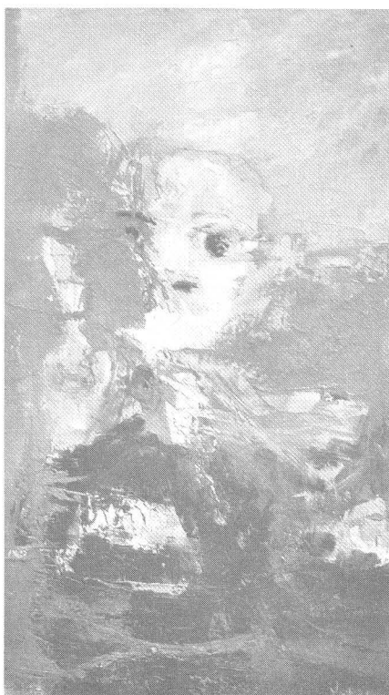
COMPOSICION Jorge Mercadé

Predomina el color difuminado a la línea y las figuras aparecen un poco estilizadas.