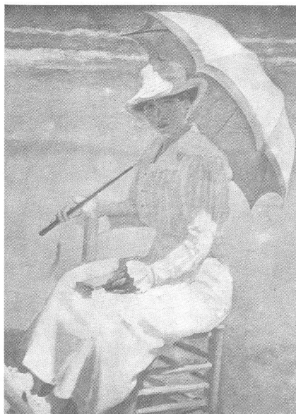
MUJER EN LA PLAYA Cecilio Plá