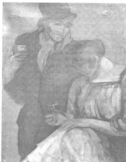
AMOR DE TABERNA Gustavo de Maeztu

recordar al maestro del desnudo femenino impresionista: Renoir, con su extraordinaria y larga serie de figuras y retratos femeninos, llenos de luminoso colorido y sana alegría sensual.