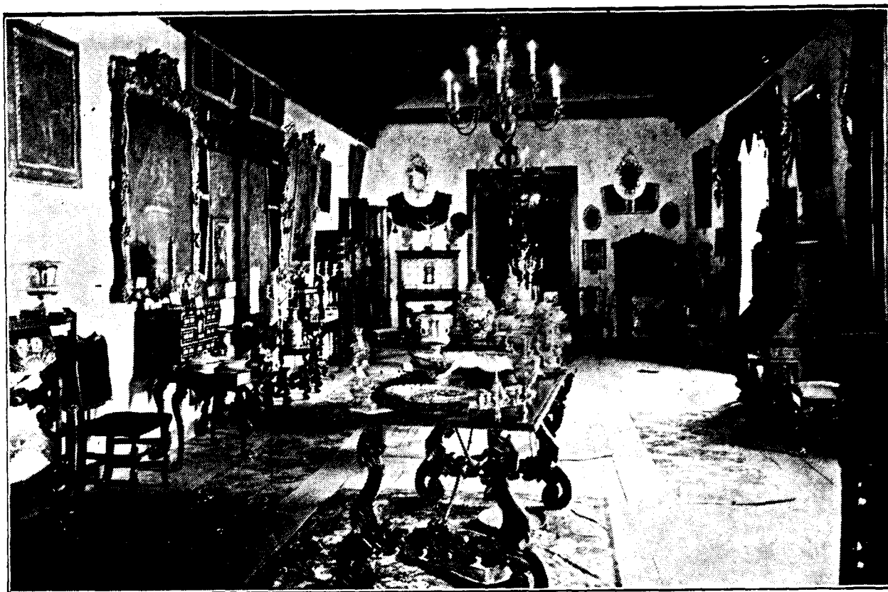
Exposición de Arte y Artesanía. La Laguna, Septiembre de 1941. Salón central.