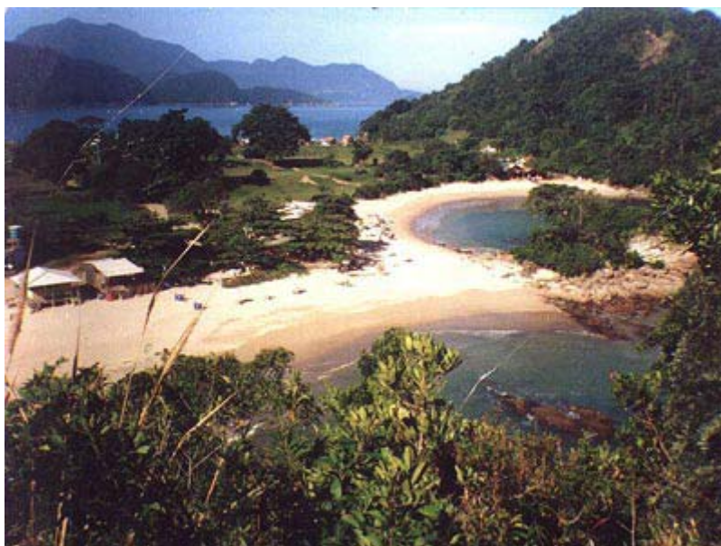
Figura 3. Praia do Meio

A Piscina Natural do Caixadaço é formada por grandes pedras vulcânicas que represam a água do mar. Possui cerca de 50 metros de diâmetro e é apropriada para a prática de mergulho (Pereira, 2001:13). É um dos maiores atrativos turísticos de Trindade, sendo muito visitada turistas.