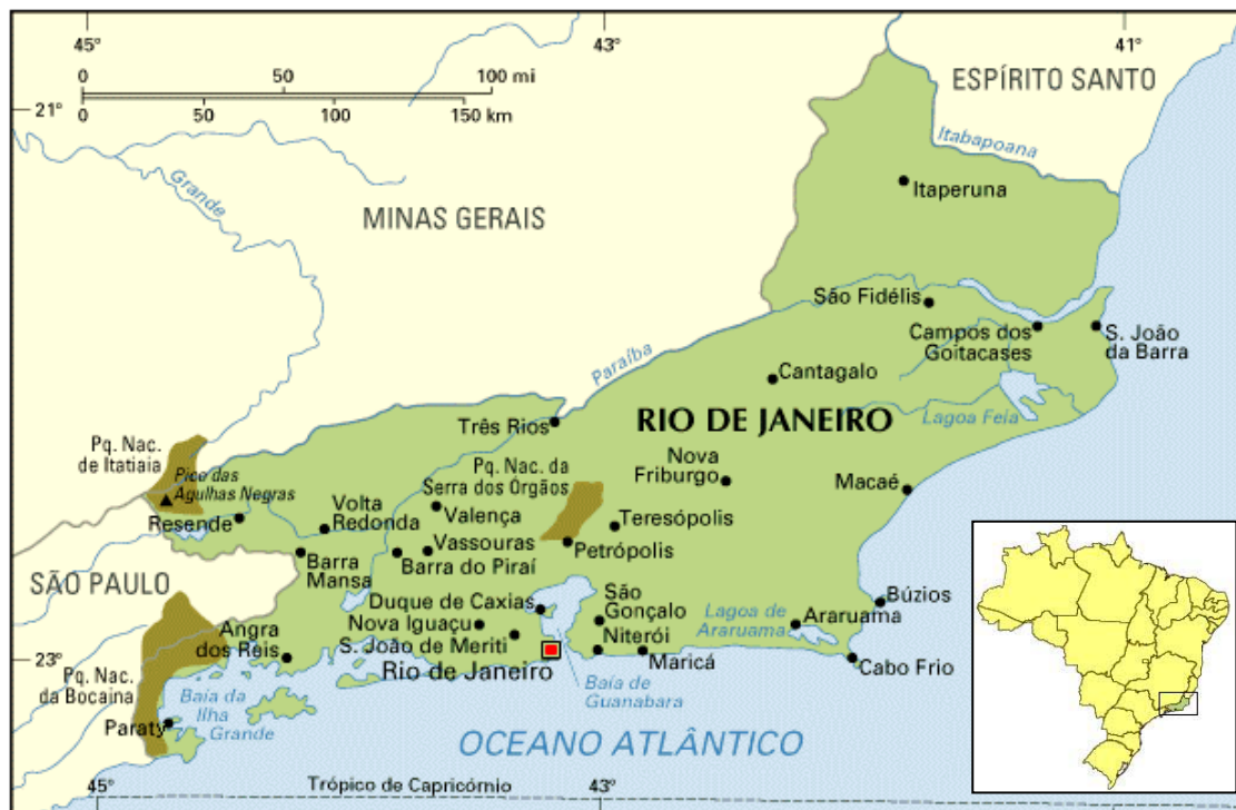
Mapa 1. Paraty

A Praia Brava é a primeira praia de Trindade, partindo do trevo de Patrimônio e seguindo-se a PRT-101. O acesso a esta só é feito por trilha a pé. Deserta e escondida entre costões rochosos e densa Mata Atlântica, não possui nenhuma infra-estrutura turística.