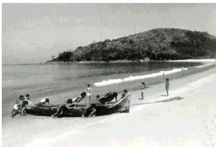
Figura 6. Trindade aldeia antiga

A falta de comunicações terrestres contribuiu para o isolamento do município. Durante esta época, o acesso à Vila de Trindade se dava somente por mar ou, como relata moradores, feito a pé. Devido ao isolamento, as populações caiçaras passaram “a viver quase que exclusivamente de suas culturas e estratégias de sobrevivência”, tecendo as redes do modo de vida tradicional (Luchiari 5 , 2000:137).