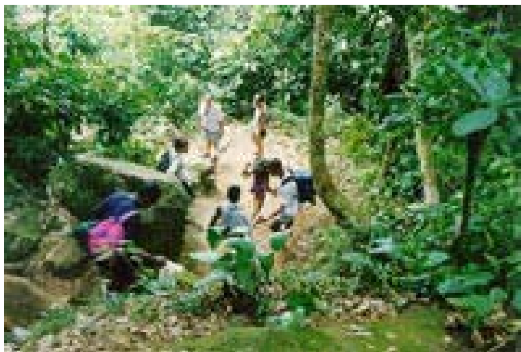
Figura 4. Trilhas rodeadas pela Mata Atlântica