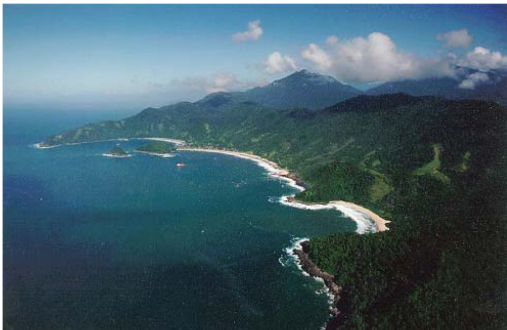
Figura 1. Vista aérea de Trindade