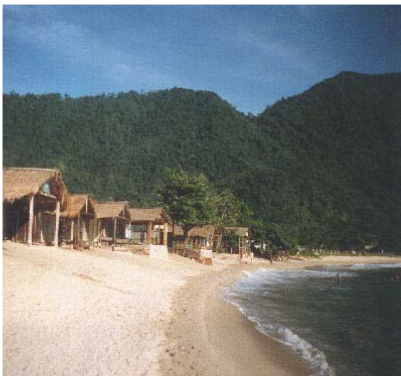
Figura 2. Praia dos Ranchos

Retomando a PRT-101, a praia seguinte é a Praia do Cepilho. Com cerca de 300 metros de extensão, possui belas formações rochosas e ondas de até 4 metros, o que atrai muitos surfistas (Disponível em: www.trindade.tur.br/-