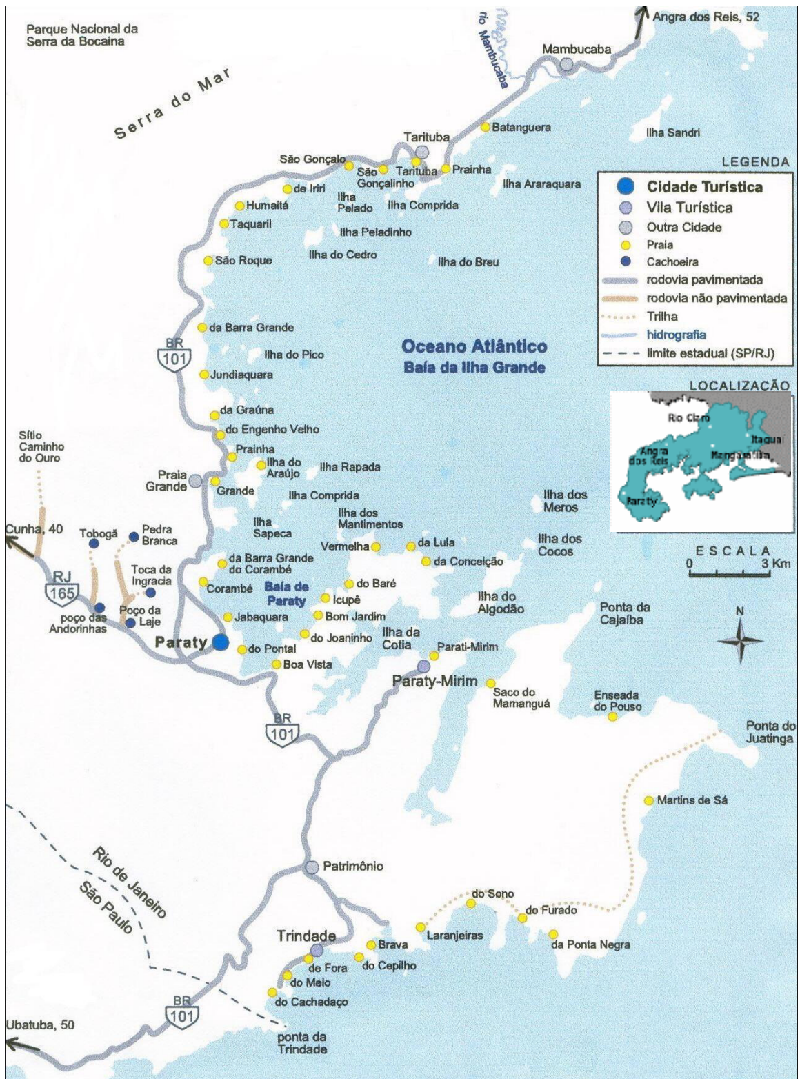
Mapa 2. Paraty: Arredores